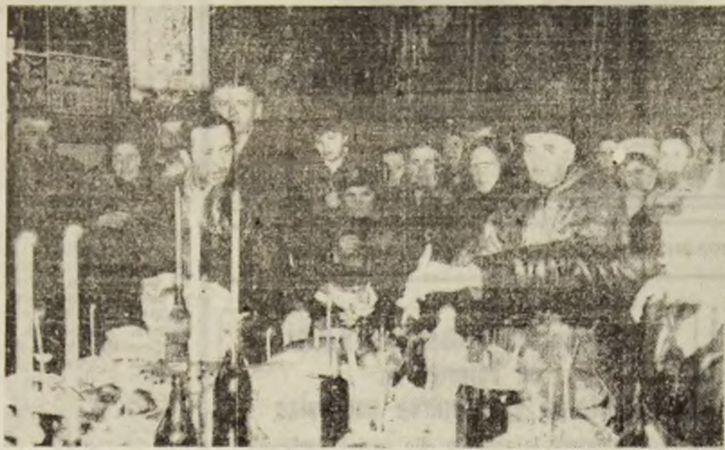
Imagine de la parastasul oficiat duminică cu aportul credincioșilor, la Biserica ortodoxă din Lonea.