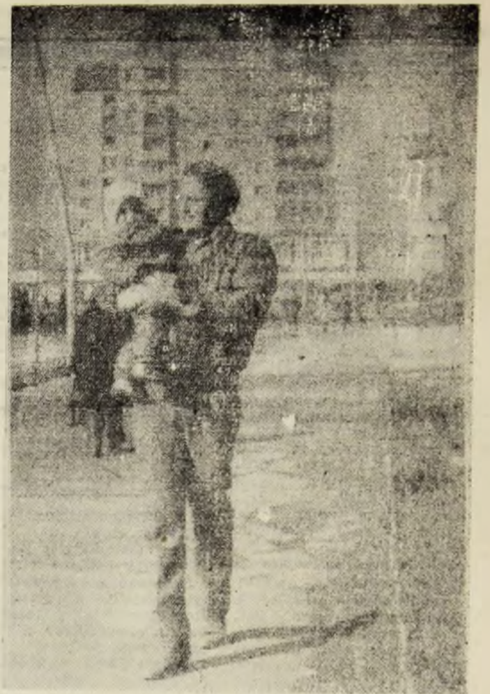
Simbloză: prezentul poartă VICTORIA, în brațe!