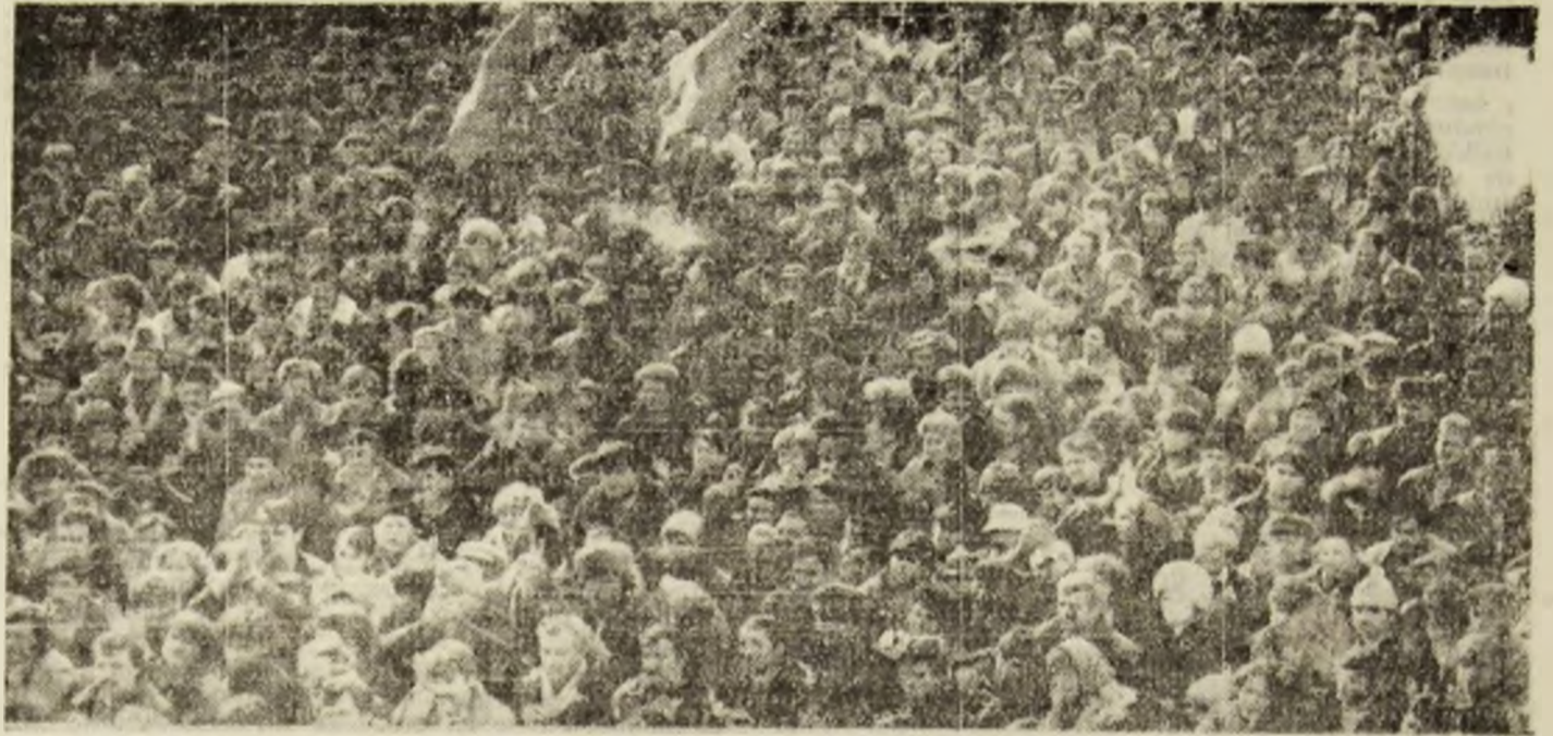
Imagini de la mitingul din Petroșani (sus) și din stația CFR, înainte de plecarea minerilor în Capitală (jos).

Iată mesajele sosite la CMVJ pe care, cu amabilitate, domnul director general ing. Ion Vasilescu le-a pus la dispoziția redacției: