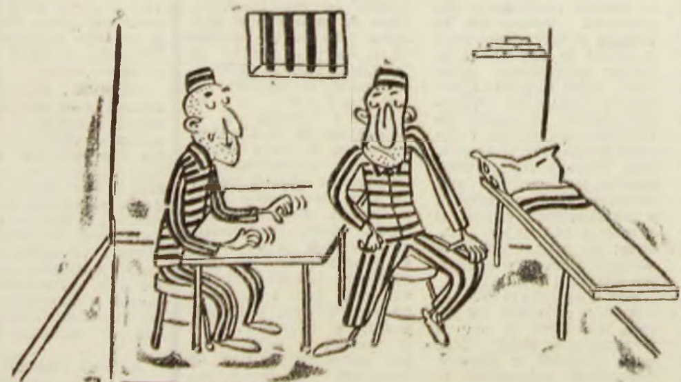
„Cel puțin partidul nostru și-a rezolvat problema sediului!” Desen de Vali LOCOTA