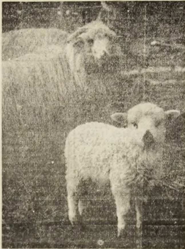
Să ne bucurăm de miei primi!