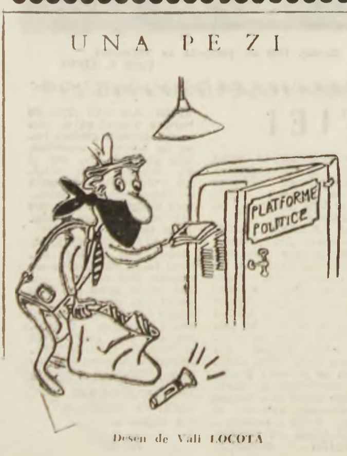
Desen de Vali LOCOTA