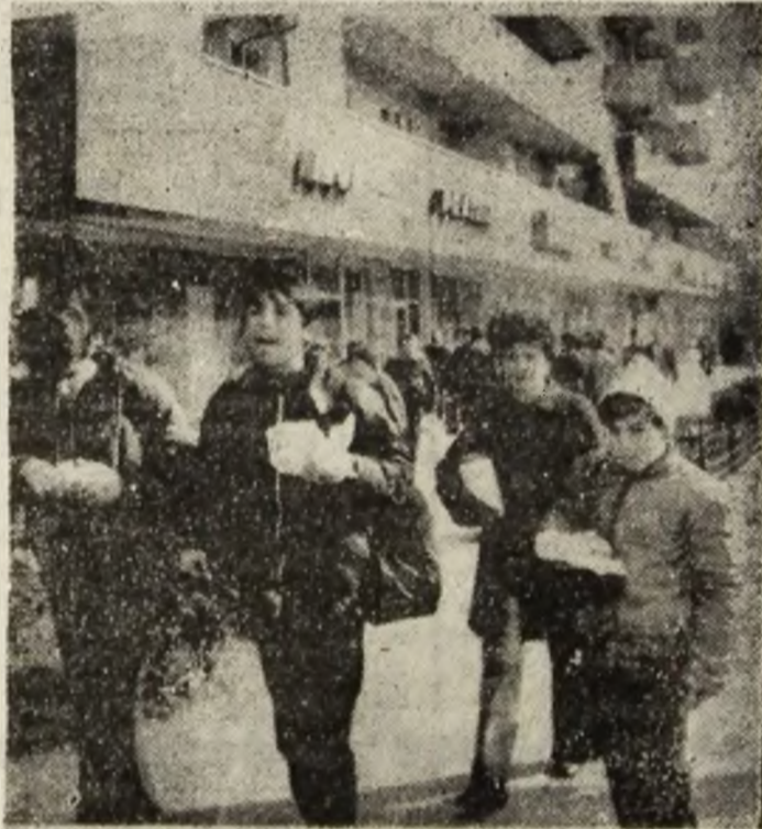
Strada. Oră de animație în Petroșani.