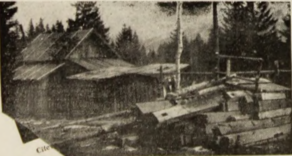
foară de 2/2 m, așa-i averea prezentă a lui Traian Bota.