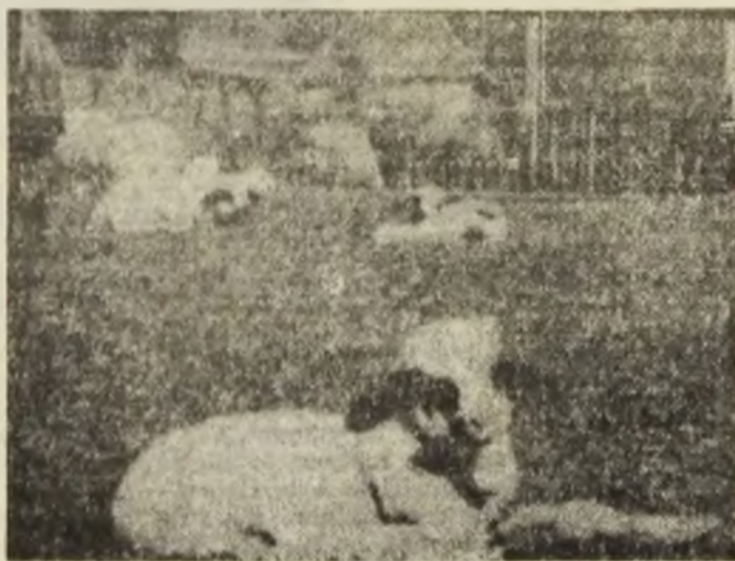
Și mieii se... odihnesc, tot-i așa ?

caldă. Bineînțeles, de culoare neagră. Situația, se pare, a intervenit, după unele lucrări electrice la punctul termic nr. 9, care alimentează aceste blocuri. Toți locatarii se întrebă, pe bună dreptate, ce va mai dura această stare de lucruri? Oamenii au nevoie de apă caldă, curată, să poată fi folosită la spălat. Să sperăm că secția specializată a IGCL Petroșani le va da un răspuns concret. Adică le va da apă caldă, nu ca pînă acum, nămol. Gheorghe CHIRVASA