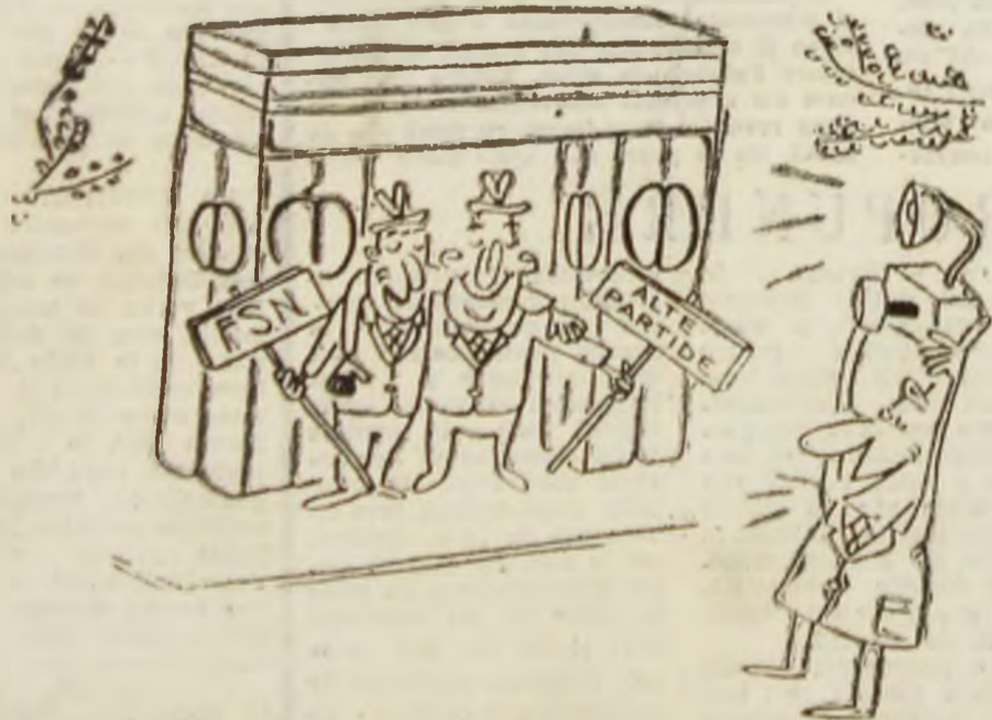
Desen de Vali LOCOA