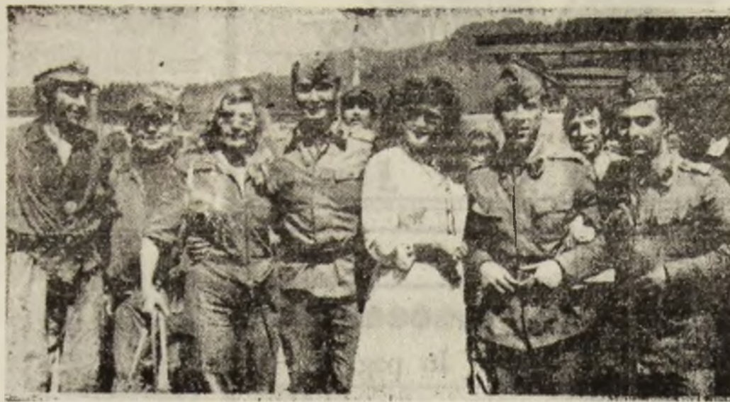
Din albumul cu amintiri: În mijlocul unor mineri și ostași, două stele ale teatrului de revistă: Stela Popescu și Vasilica Tastaman.

SPORURI. Ni se anunță o veste bună din rețeaua alimentarelor. A fost du-