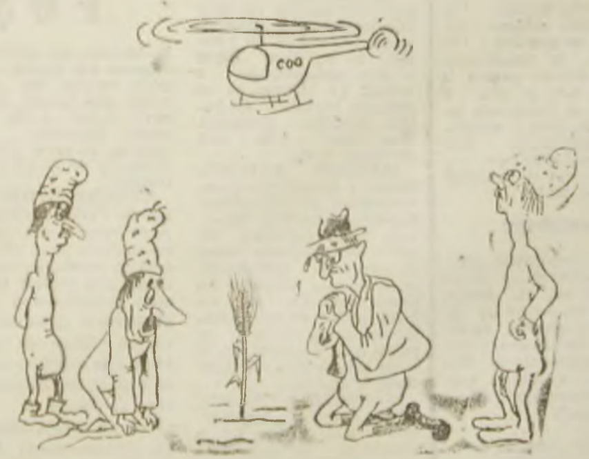
În așteptarea vizitei de lucru.