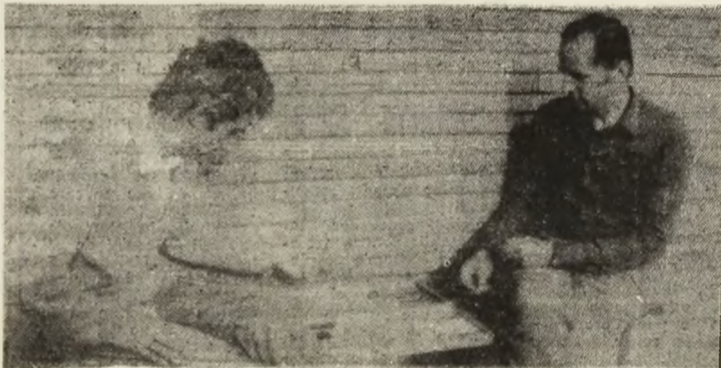
În loc de „Daciada”, a rămas sportul de masă — tablele!