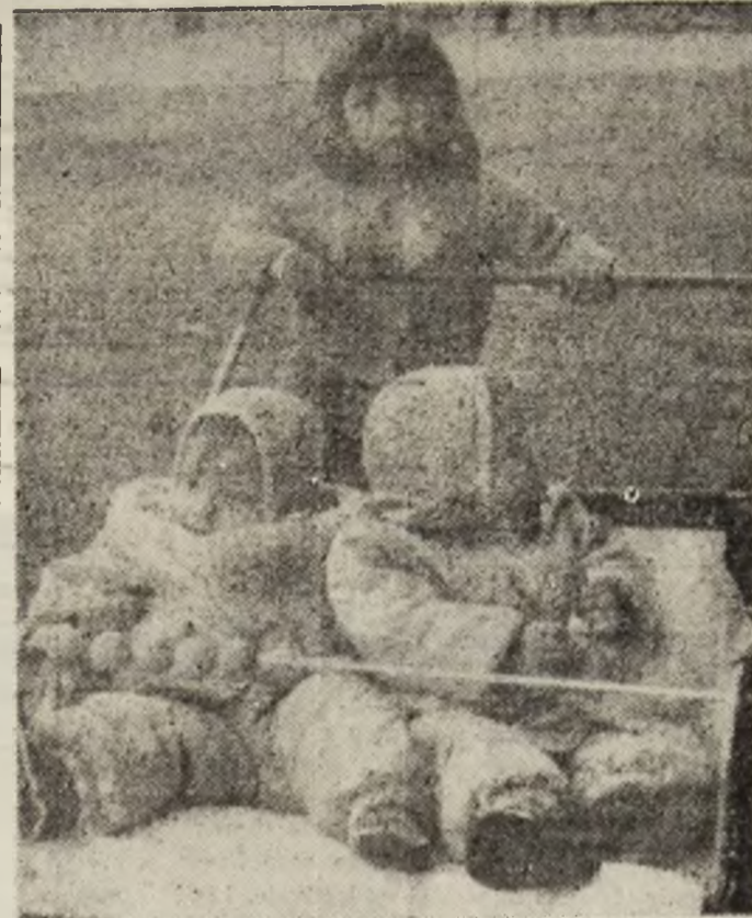
Şi ei vor să fie în Asociaţia gemenilor liberi!