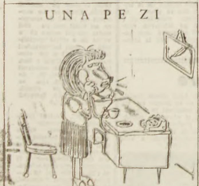
— La noi la birou s-a renunțat definitiv la ședințe. Acum facem mingurii! Desen de Vali LOCOTA