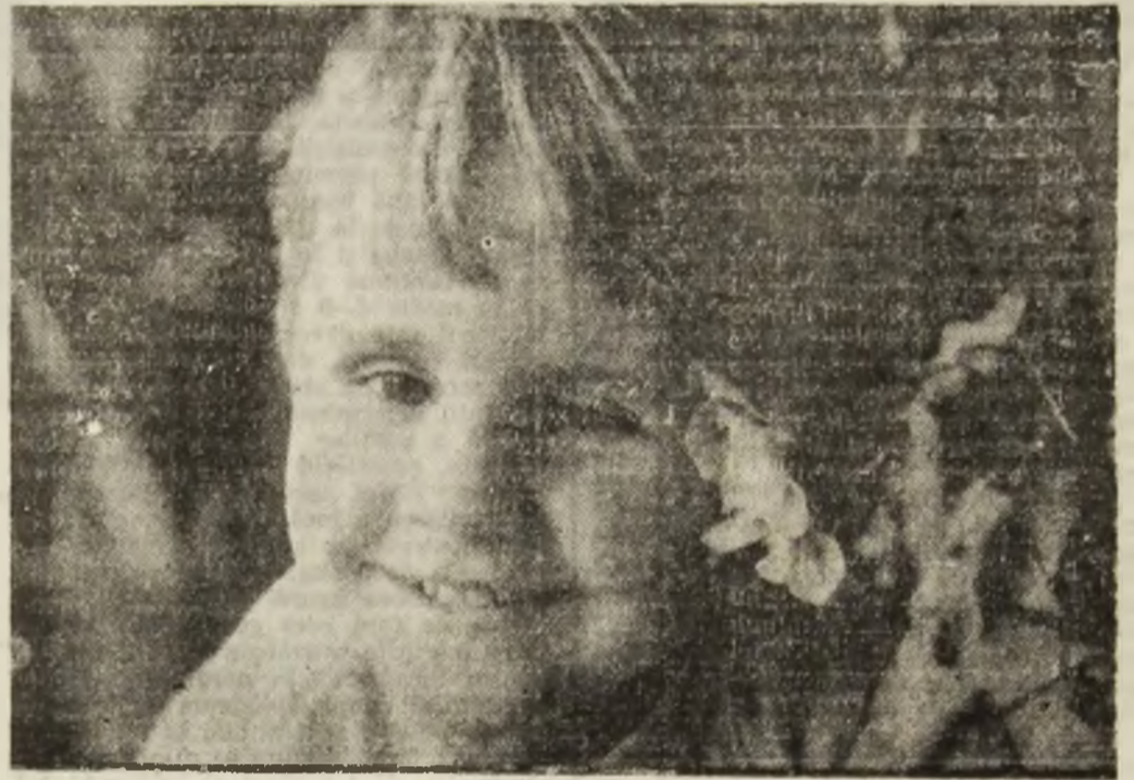
Un copil cu flori...