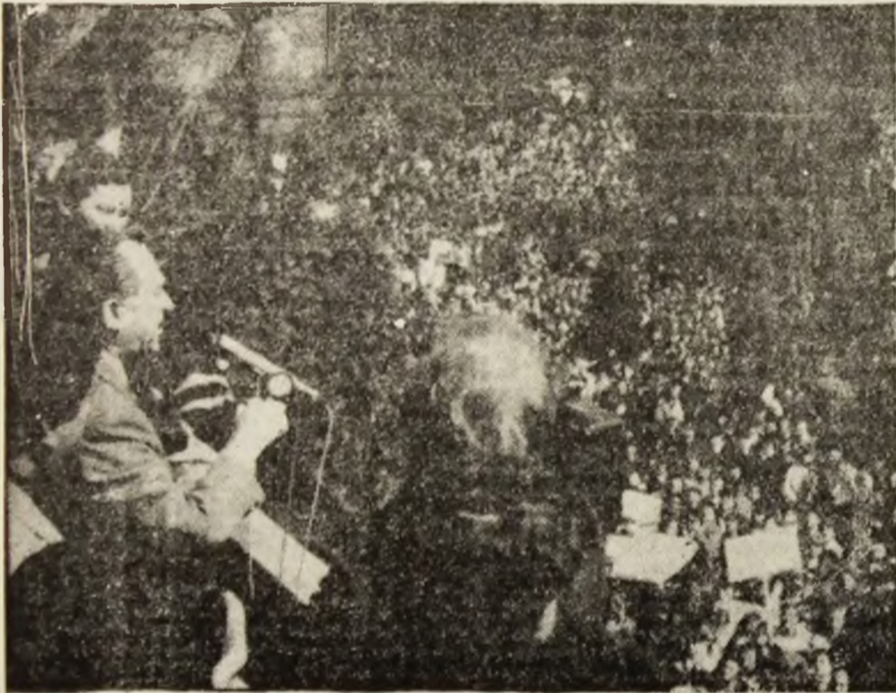
Aspecte de la întrunirea electorală din Petroșani.