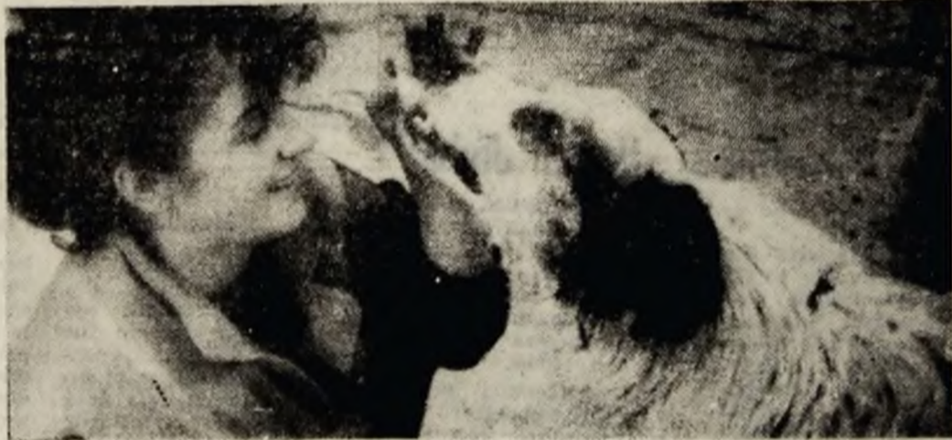
Un credincios prieten al omului.

Așadar, este clar că apartamentele fiind repartizate unităților economice, consiliile de administrație și sindicatele libere din acestea poartă toată răspunderea pentru modul în care le repartizează. Primăria își extinde acest drept doar asupra celor 29 de apartamente din zona proprie. Facem această precizare pentru a informa pe cei interesați unde să se adreseze pentru obținerea de locuințe și să nu mai fie nevoiți să bată drumurile și să piardă timpul pe la primărie, în dorința de a-și rezolva problemele legate de atribuirea locuințelor.