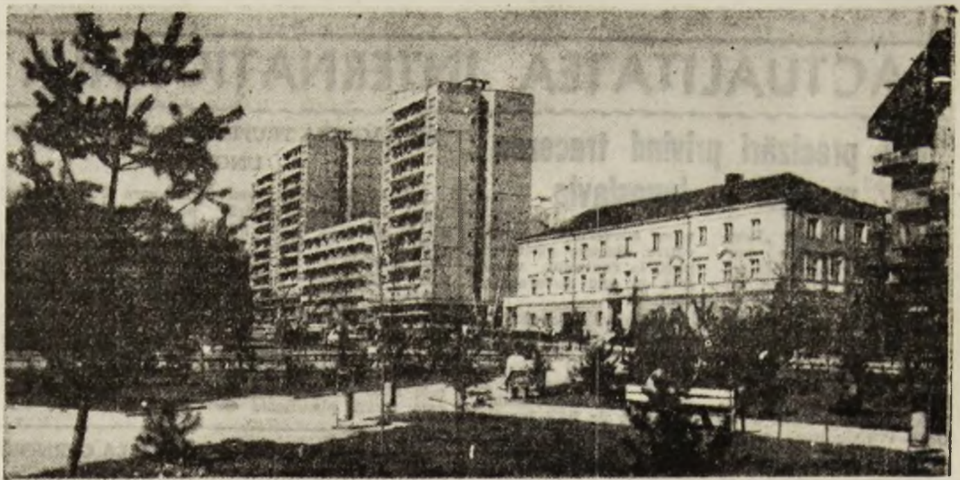
Și Petroșaniul ar putea fi frumos. Dacă ar avea parcuri... terminate.