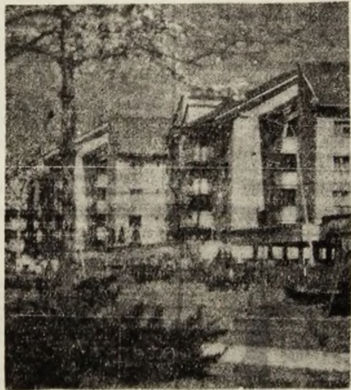
Blocuri sub Virful Roșia? Nu! O simplă glumă a aparatului de fotografiat...