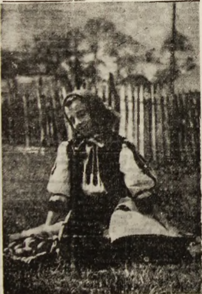
Adolescența se trăiește mai intens în cadrul natural.