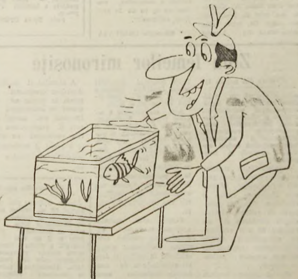
...Iar dacă ai și tu ceva de revendicat spune-mi în față, nu te jena! Caricatură de Vali LOCOTA