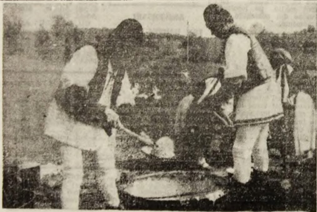
E vremea nedeilor.