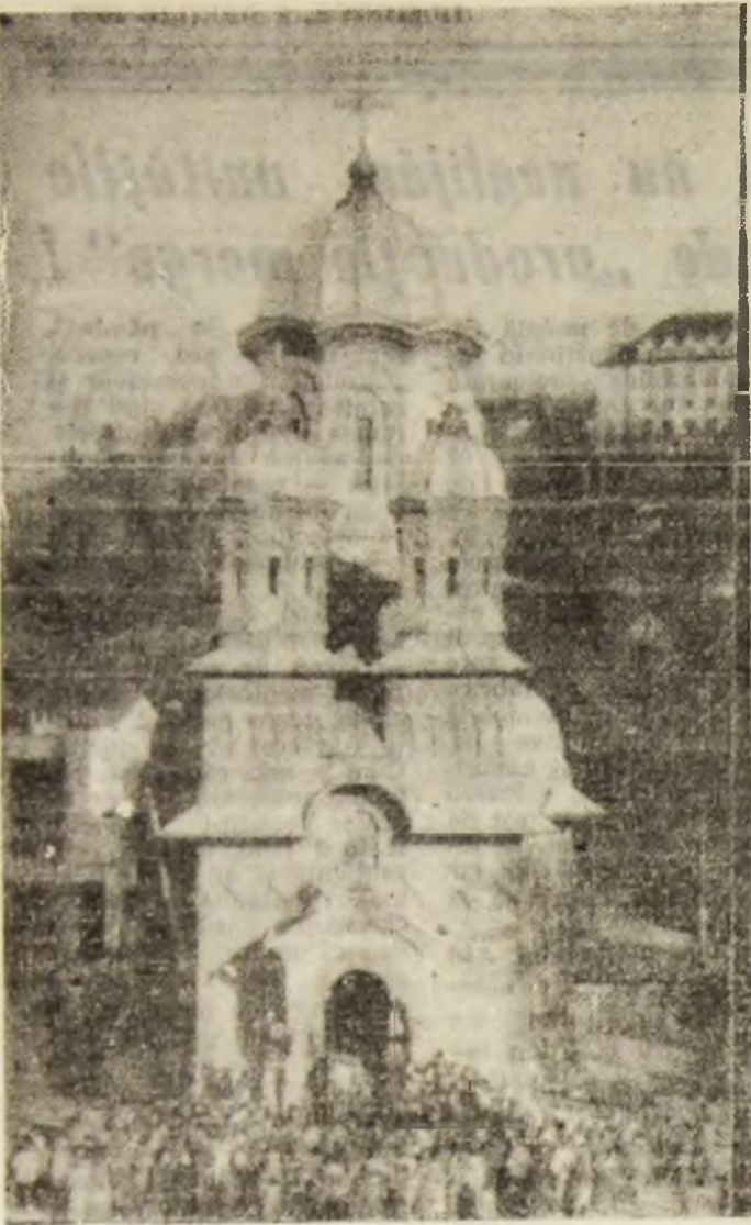
Această imagine putea fi surprinsă, ieri, în fața tuturor Bisericilor din Valea Jiului, unde au fost oficiale slujbe de pomenire.