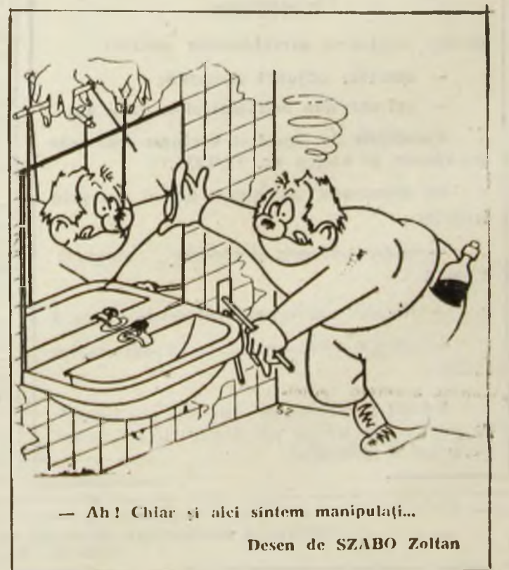
— Ah! Chiar și aici sintem manipulați...