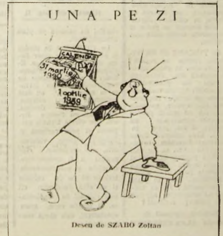
Desen de SZABO Zoltan

CARICATURISTI: Robert HUMEL, Vali LOCOTĂ, SZABO Zoltan.