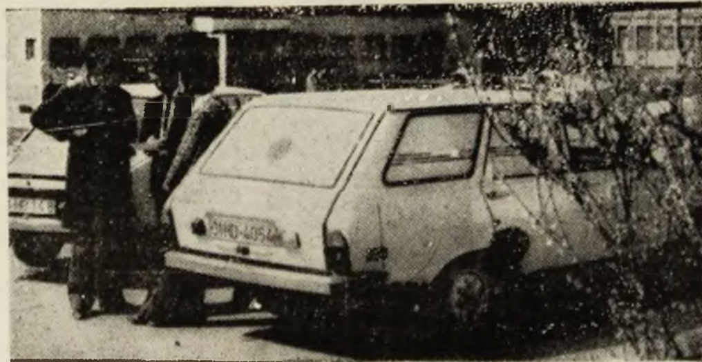
Mașina „Salvării” peacă într-o nouă cursă. Bineînțeles, cu foaie de parcurs.

ANONIM, Petroșani: Din principiu nu răspundem scrisorilor anonime. Întrucît cei care nu semnează au și altceva de ascuns decît numele. Nu este cazul dv. Din scrisoarea dv. lungă (12 file) trimisă de curînd se desprinde o mare sinceritate. Sînteți un sentimental, cum singur vă prezentați, „legat cu mii de fire trainice de cele două mame sfînte, România și Maria”. Pentru această mărturisire, pe care avem convingerea că nu o faceți cu orice preț, vă răspundem, cu două precizări: 1) spațiul nu ne permite o scrisoare la fel de lungă; 2) oricît ne-am strădui, mărturisirile noastre nu vor atinge gradul de emoție care a încălzit