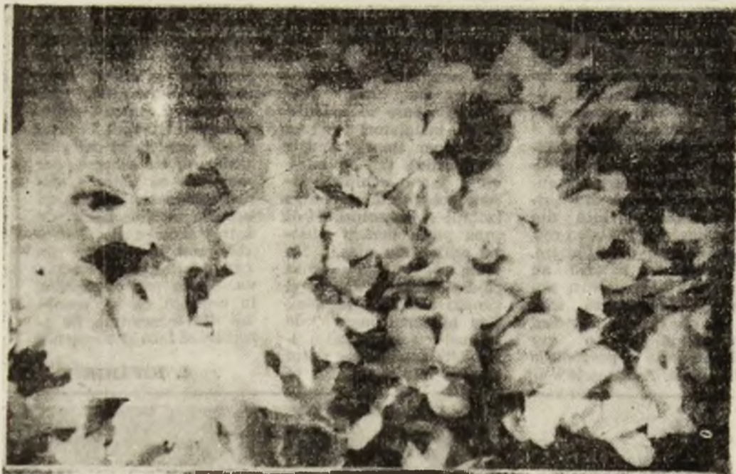
Și magiștii sînt trecătoare...