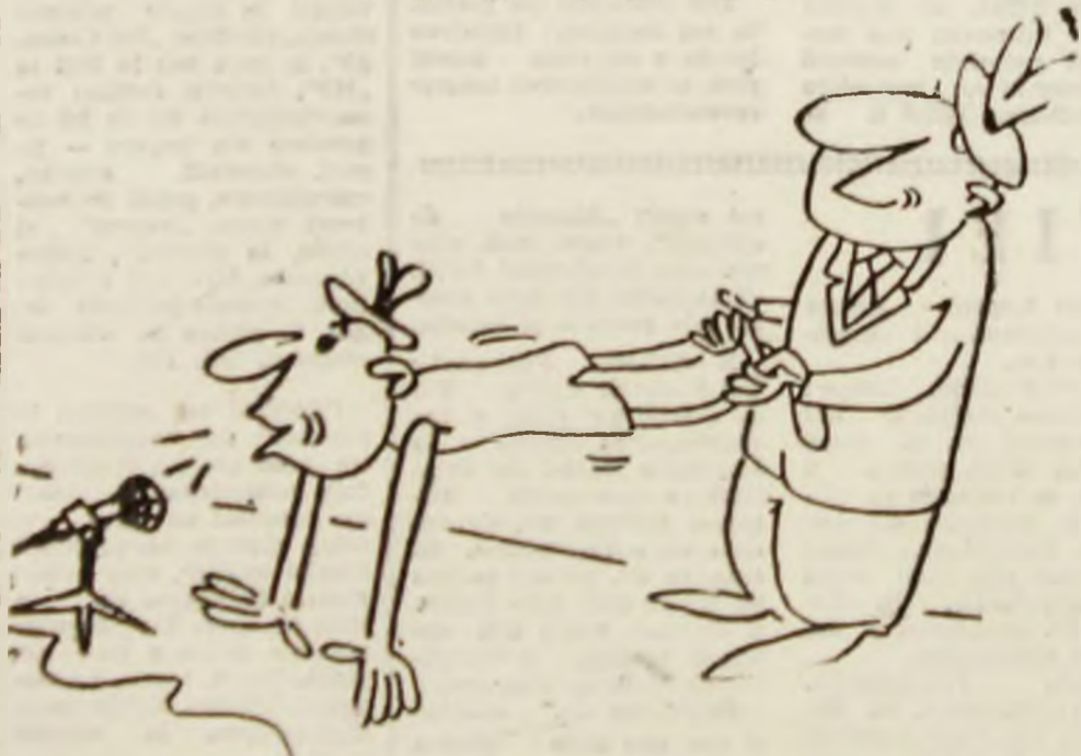
— Cu acest prilej (în să dezminț zvonul după care ar fi manipulat de cineva) Desen de VALI LOCOTA

Sîntem la peste o sută de zile după ceea ce s-a întîmplat în decembrie, după ceea ce era de așteptat și era firesc să se întîmple.