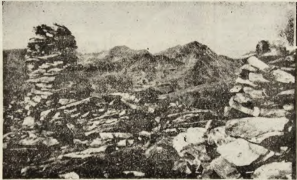
Imagine panoramică de pe virful Custura — Retezat.

S-au făcut mitinguri, greve, deplasări la București îndreptățite, chiar dacă unii nu consideră că ar fi tocmai așa, s-au ridicat revendicări, drepturi meritate de altfel, care o bună parte au fost aprobate. Dar, după cum s-a văzut, cărbune nu prea s-a dat. Ar fi cazul ca, cei puțin de acum, din acest trimestru să ne sporim eforturile pentru a da cărbune nu pentru a răsplăti guvernul care a acordat drepturile, care a validat revendicările, ci pentru ȚARA, pentru ROMANIA care astăzi pășeste cu încredere în Europa, cu fruntea sus, pe drumul DEMOCRAȚIEI, al LIBERTĂȚII și DEMNITĂȚII. În fond întregul popor, toată țara este cea care a acordat drepturile, revendicările solicitate. Și țara, trebuie răsplătită pentru eforturile făcute.