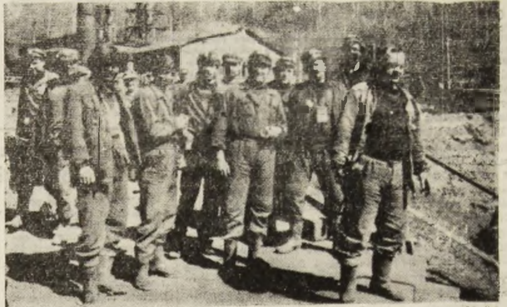
Mineri ai Bărbăteniului. La ieșirea din mină, o răsplătă bine meritată după orele de muncă și încordare în subteran — razele generoase ale soarelui primăvăratesc.

plasările minerilor la București. E mindru de tot ce au făcut și au obținut minerii. Este de acord că o societate democratică nuse poate făuri fără mai multe partide, fără controlul acestora, al poporului, asupra celor care dețin puterea. Dar dincolo de păreri diferite, de confruntări importante sînt conlucrarea, unitatea în muncă și aspirații a tuturor cetățenilor pentru a înfăptui binele țării și al tuturor. La întrebarea ce este esențial pentru redresarea minei, a producției, a avut un răspuns precis: schimbul de miine — stabilizarea și profesionalizarea noilor contingente de tineri pentru a fi capabili să ducă mai departe ștafeta mineritului.