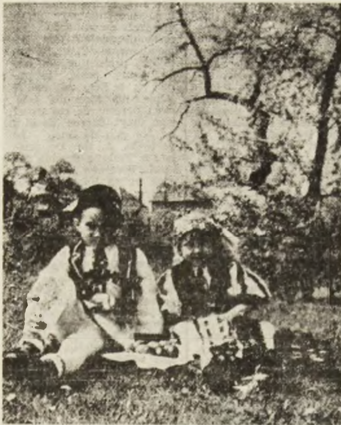
Etnografie, datină și credință din fragedă copilărie.