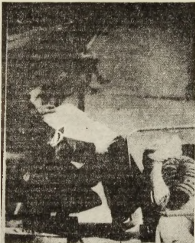
Visete frumoase ale copiilor sînt veghente de pînă adevărați.