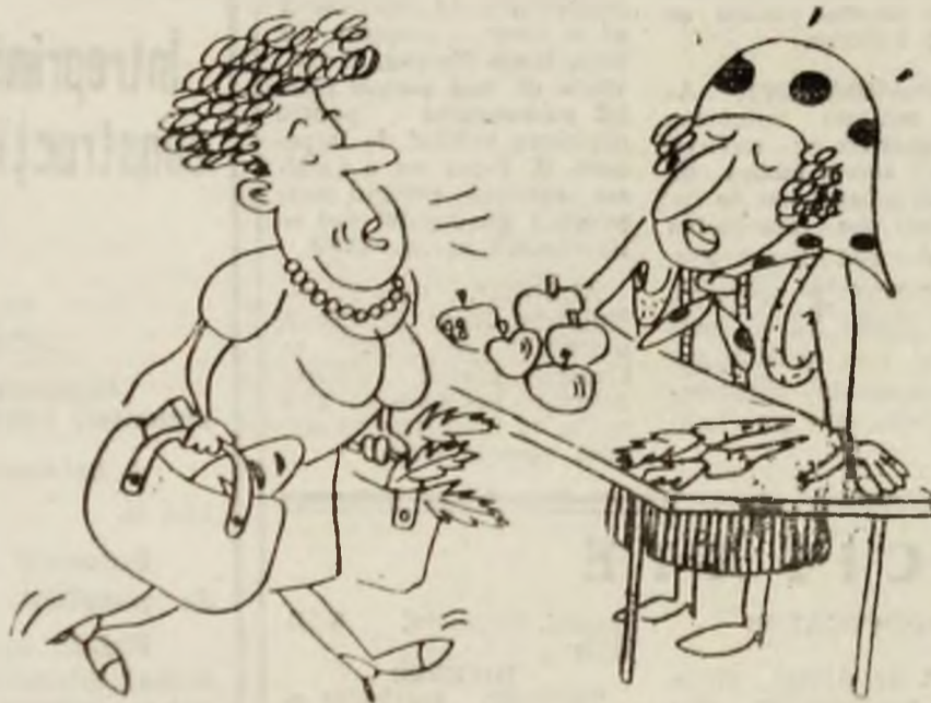
— Dragă, ai văzut cum se mai țînguie ăia prin C.P.U.N. ? Desen de Vali LOCOTA