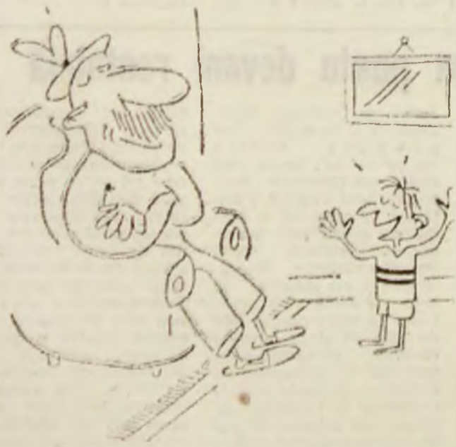
— Apropo de răfuclii tătucule: astăzi l-am bătut măr pe băiatul fostului tătuc șef!