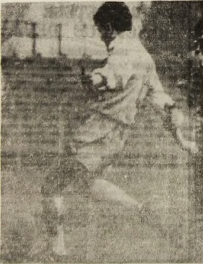
Știința — Dinamo 9—6. Cu această lovitură liberă, Știința se va desprinde decisiv, câștigând în final cu scorul de 9—6 în fața fostei campioane a țării.