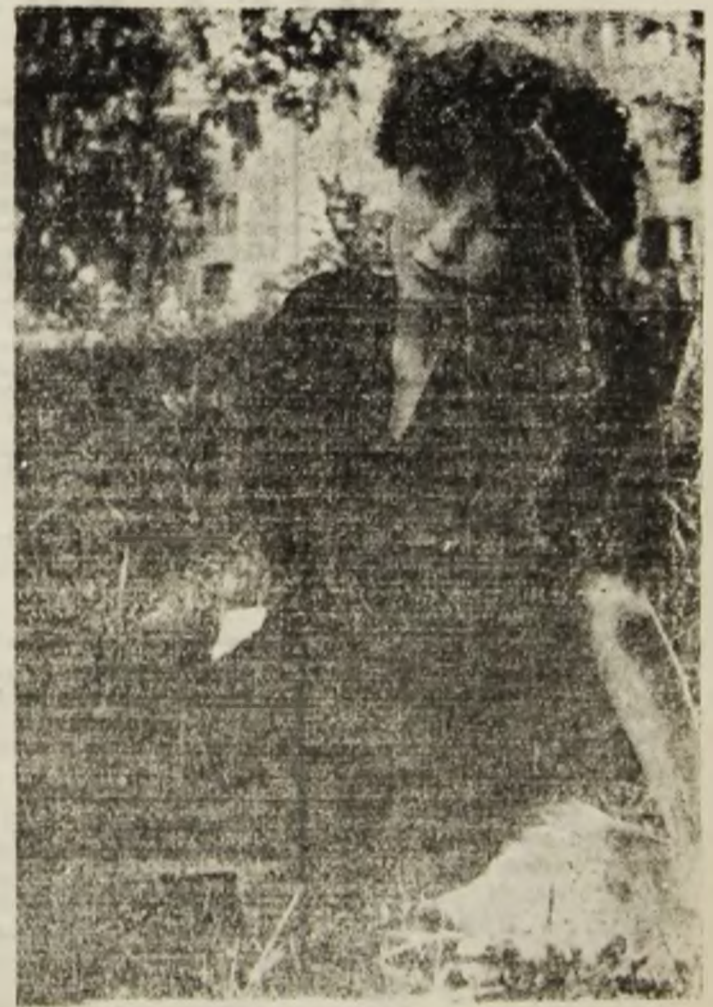
Melancolie de primăvară.