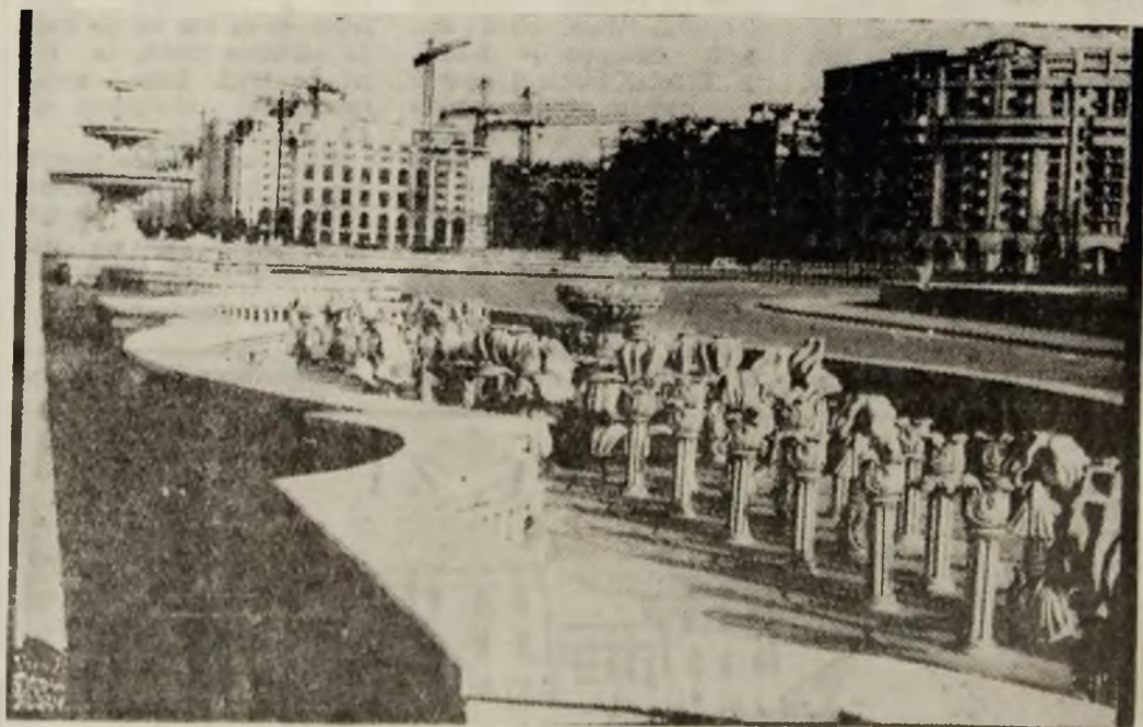
Grafică arhitecturală — București.

Țăranul român dă țărani fără să ceară nimic în schimb. Să nu-l obligăm să creadă în vorbe și promisiuni. Răstîngînt între pămînt și cer, el are rădăcini trănice, sufletul curat și tare ca aerul înălțimilor. Politica trece peste el ca norii peste piscurile munților noștri mlațnari. El rămîne.