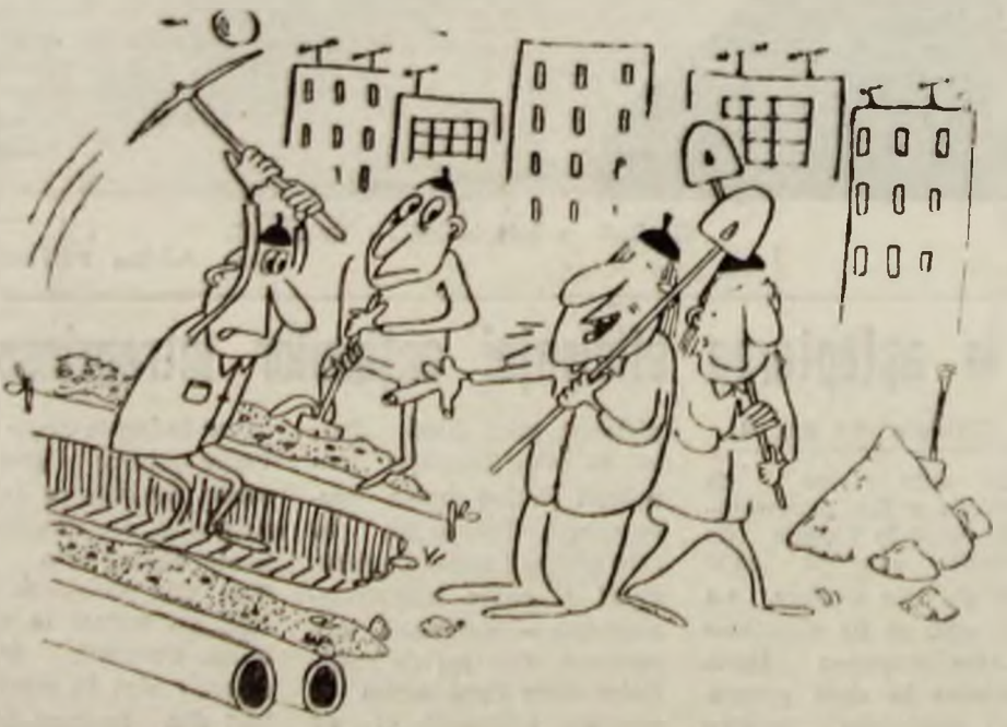
— Cînd aveți de gînd să lăsați fleacurile astea și să analizăm conștient ultima ședință a C.P.U.N ? Desen de Vali LOCOTA