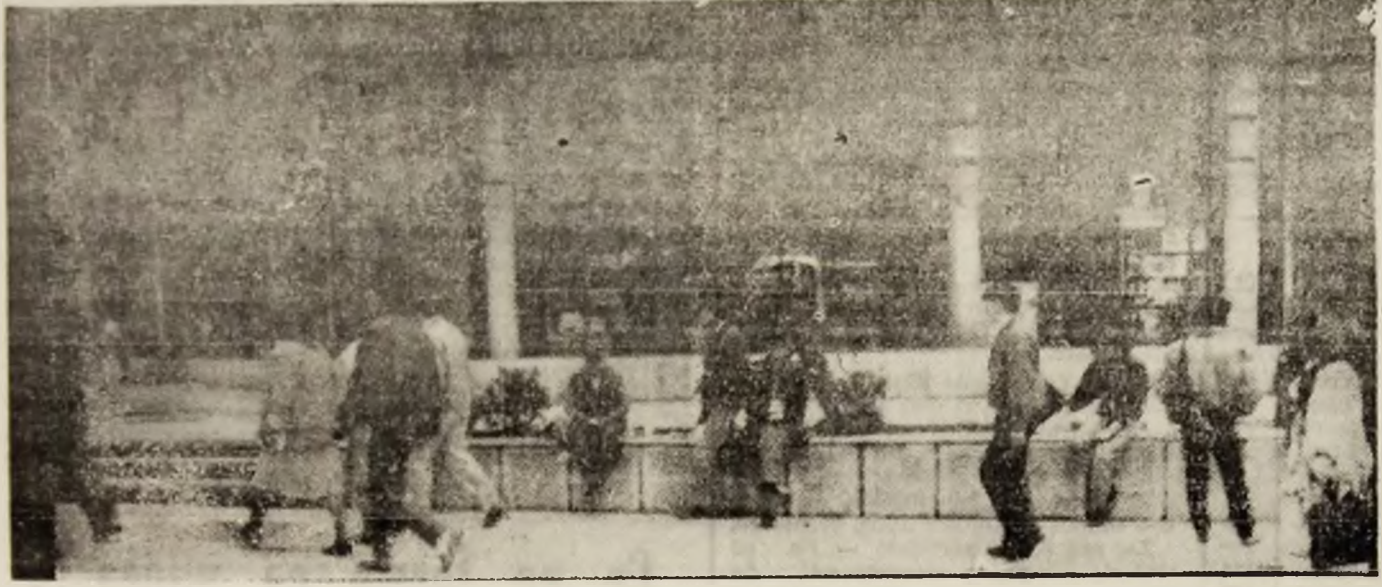
Trecătorii își văd de drum, iar bișnițarii...

ANUL I, NR. 111 JOI, 10 MAI 1990 4 PAGINI — 1 LEU