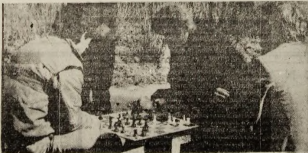
Șah-mat, în fața blocului.

Din rîndul snobilor se recrutează cei care sînt ușor de cumpărat pentru o cauză străină lor. De cele mai multe ori snobul este cumpărat prin moneda audienței, căci vorbitorii de genul lui își caută ei audiența, nu invers. Dacă în domeniul artistic sau vestimentar moda și snobul au unghi chiar un rol pozitiv, în domeniul politic, unde trebuie să domnească consensul și raționamentul realist, moda este periculoasă și dăunătoare. Pentru că este o mare diferență între a alege o pereche de pantaloni sau conducătorul unei țări.