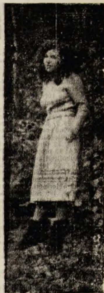
Privind (cu melancolie) spre o idilă trecută și (cu speranțe) spre una viitoare... Ieacul pentru dragoste este... o altă dragoste.