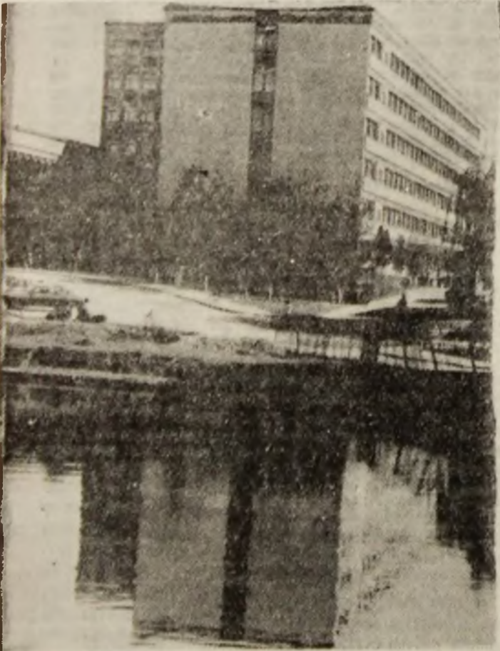
Și Petroșaniul are... curiozități.

ordine, continuă dl. Sulfletu, în secțiile de votare vor intra cîte șase alegători. E nevoie, deci, de răbdare, și cred că oamenii vor înțelege acest lucru. Este de dorit ca toți cei cu drept de vot să se prezinte la alegeri. E în interesul țării. Numai așa va putea fi cuantificată cu adevărat voința poporului.