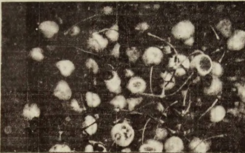
Dulceața cireselor de mai ne îndeamnă la o... dulce via.