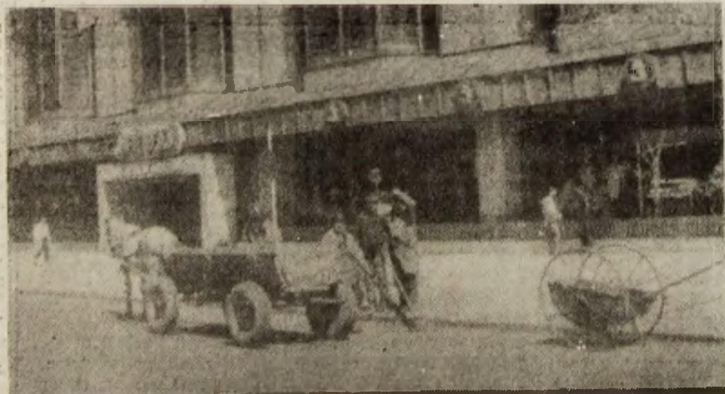
Iată-i la lucru pe acești oameni de care ne amintim doar atunci cînd ni se pare că nu și-au făcut datoria.

asemenea, încercăm să modernizăm rampele noastre de gunoi și căile de acces spre acestea. În perspectivă ne-am propus realizarea unei stații de incinerare. Convertirea în metan a resturilor menajere depășește decamdată posibilitățile noastre. Această problemă rămîne deschisă pentru viitor.