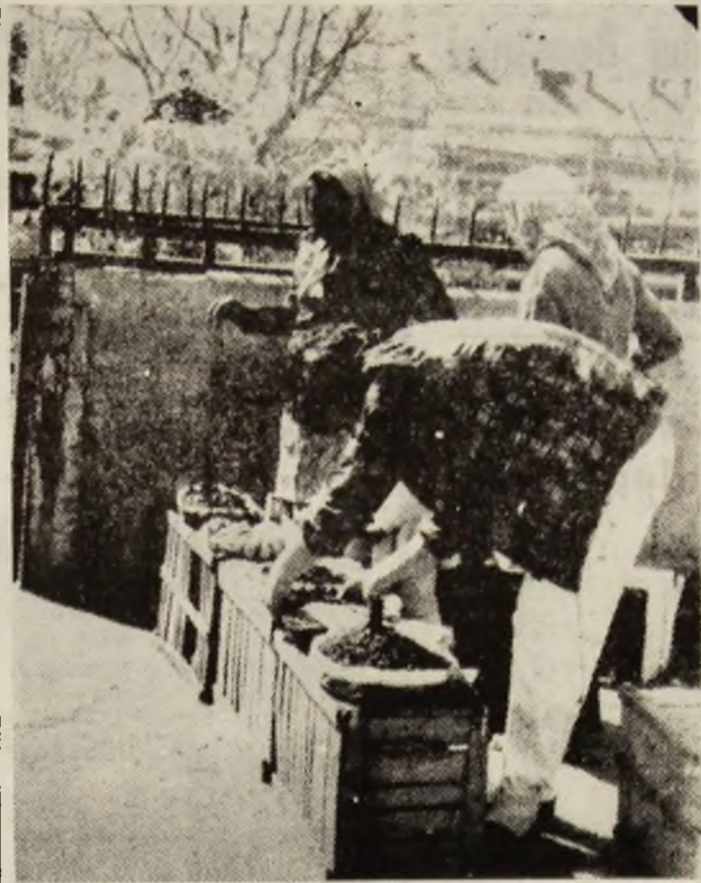
Nu mai rămîne loc pe trotuar de atita... comerț stradal. Semințările nu mai vind doar semințe vind tot!