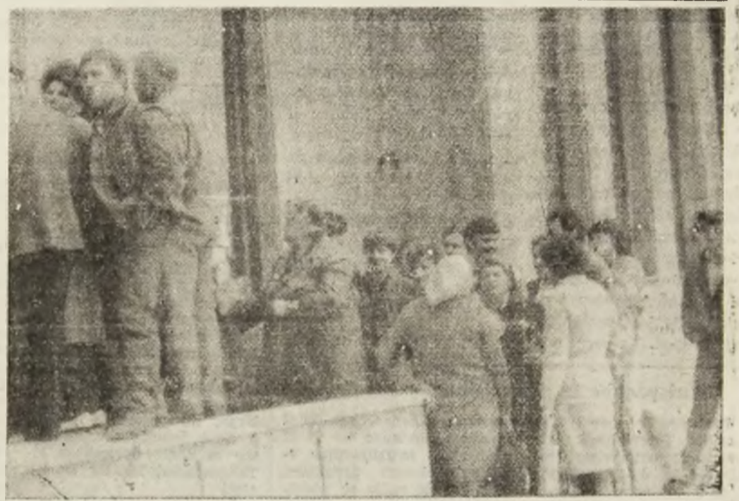
Coadă la valută...

Detalii privind rețeaua, planul de școlarizare și specialitățile în care se vor pregăti elevii se pot obține de la ministerele și celelalte organe centrale care organizează școli postliceale de specialitate sau de la inspectoratele școlare județene.