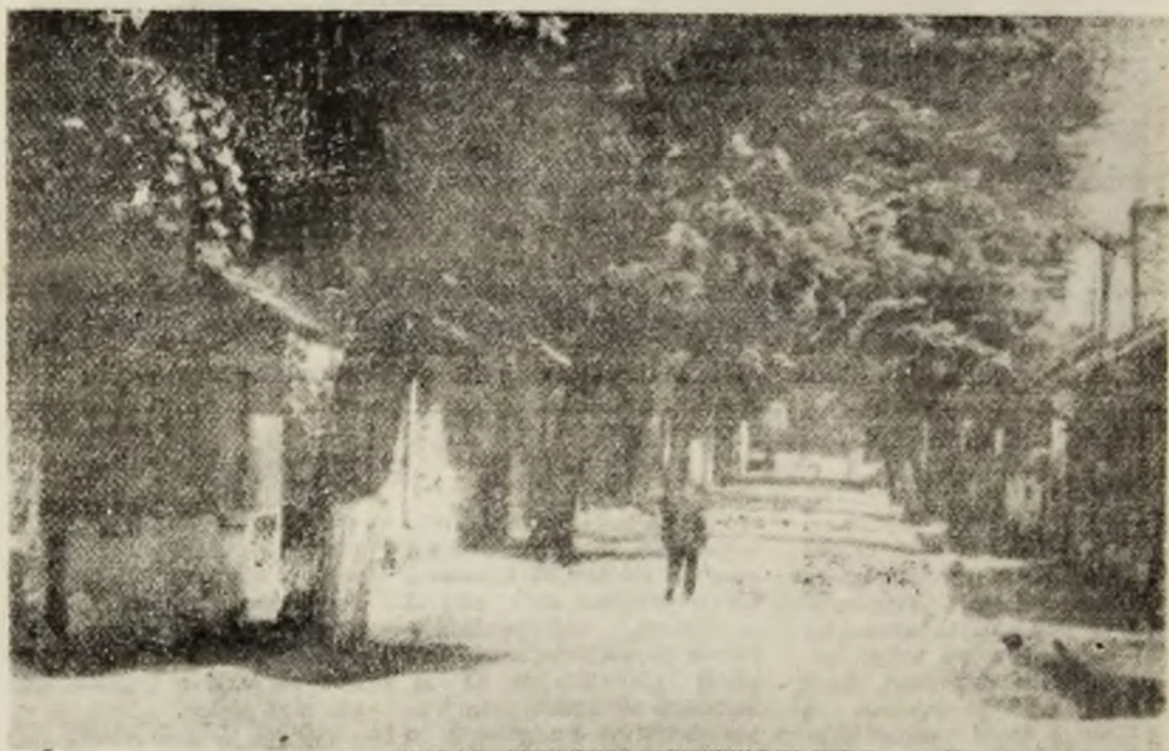
Petroșani — vechea colonie.

Condițiile de înscriere se cunosc. Cele de admitere, de asemenea. Le dorim succes tuturor tinerilor care bat la poarta învățămîntului superior. Ele se vor deschide cu o singură cheie: știința de carte. (M.B.)