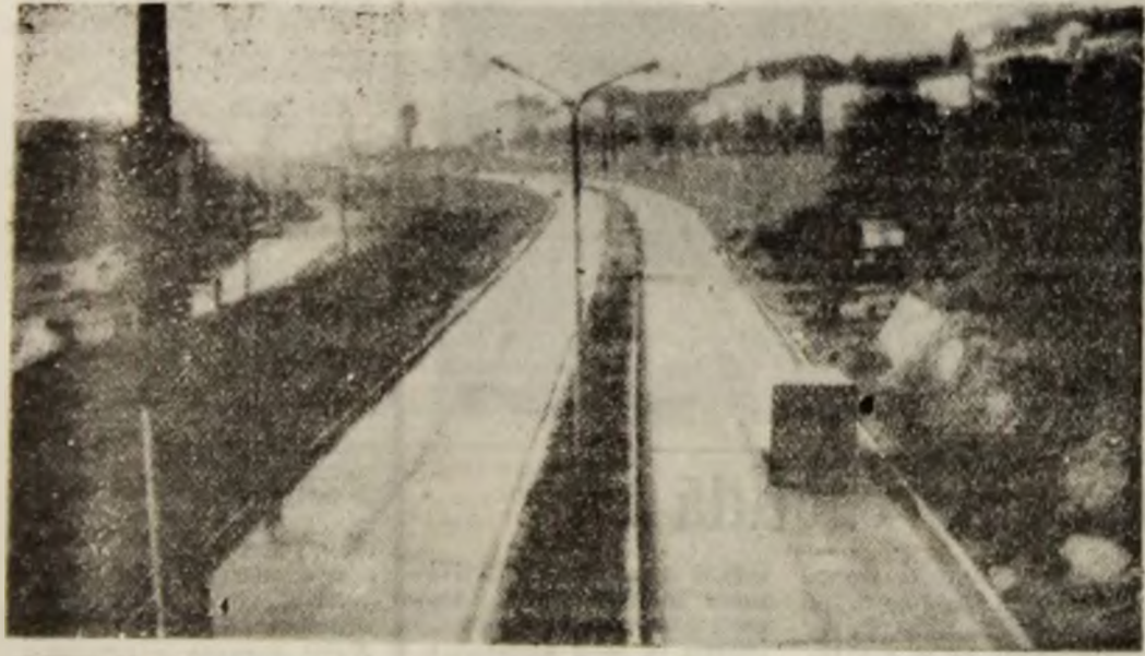
Petroșani. Transport industrial pe „centura” orașului.