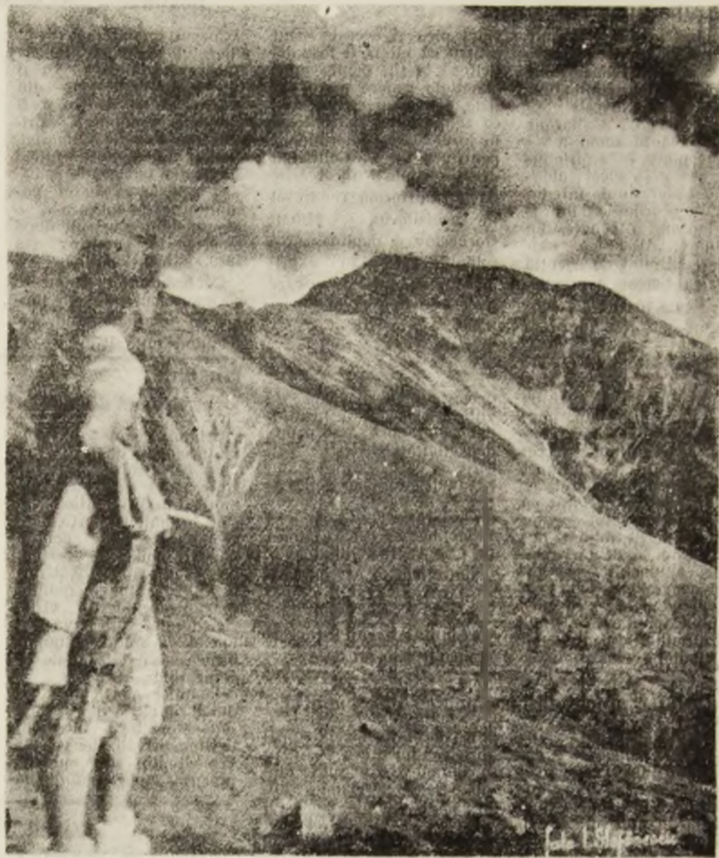
„Paring 2405m” sau „Cârja — Paring”