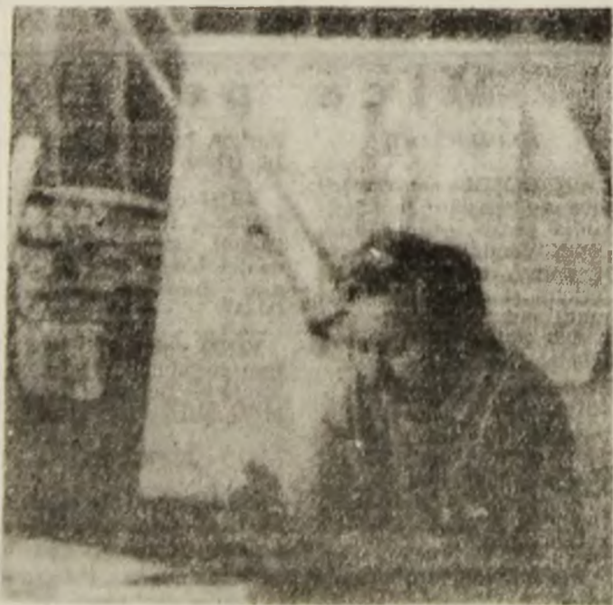
Creația tehnică este parte indivizibilă a activității colective a IPSRUEEM Petroșani.

În condițiile trecerii la economia de piață, recuperarea materialelor și pieselor devine de acută importanță. Rezultatele, deși sînt bune, spun specialiștii, pot fi și mai bune, dar cu contribuția unităților miniere. Ele sînt chemate să sprijine formațiile IPSRUEEM cu echipele specializate în dezmembrarea și încărcarea fierului vechi, potrivit cifrelor stabilite, cu respectarea contractelor cu furnizorii.