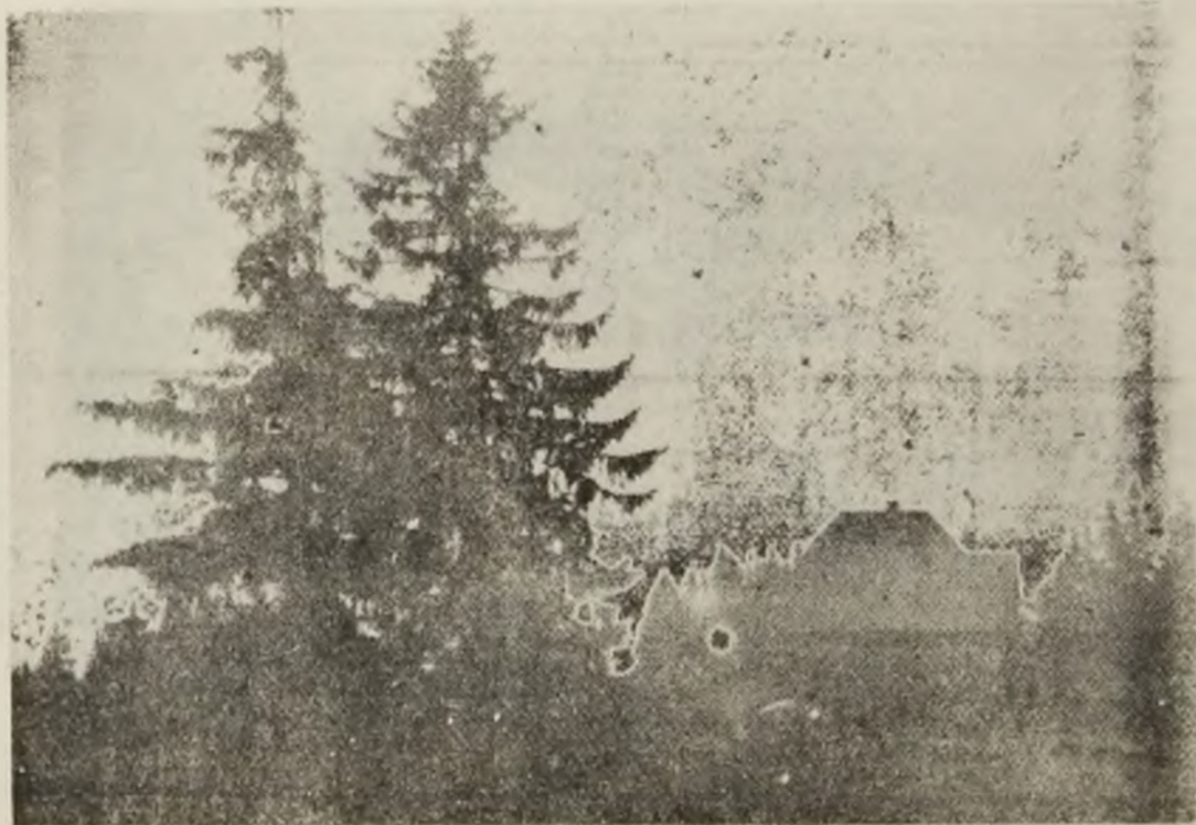
Singularitate în mijlocul naturii.