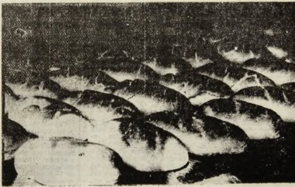
Noua linie tehnologică, de la capacitatea nr. 1 a Intreprinderii de morărit și panificație Petroșani: calitate, eficiență, aspect comercial.

O adevărată pledoarie pentru pîinea pe care o mîncăm.