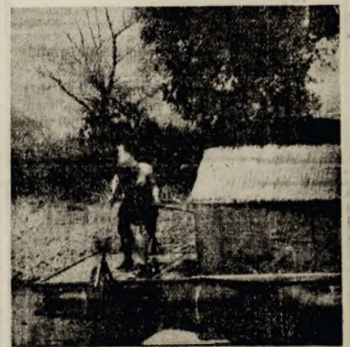
Cu pluta pe Mureș.