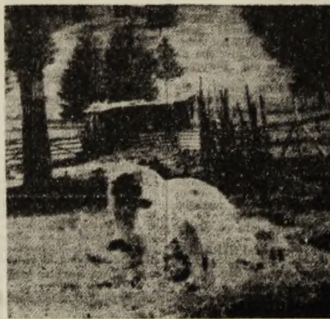
„Homo homini lupus”! Deci, avem nevoie de păzitori la „stîna” omeniei.