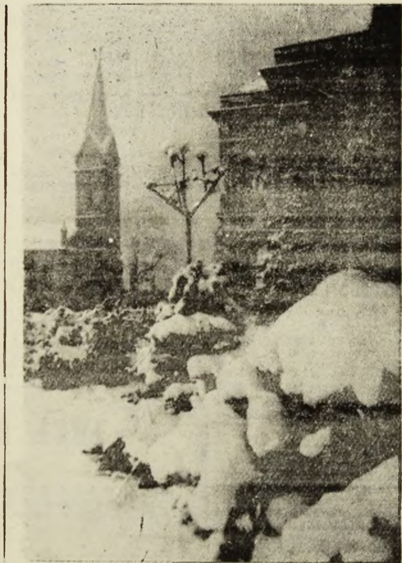
E iarăși iarnă-n Petroșani.