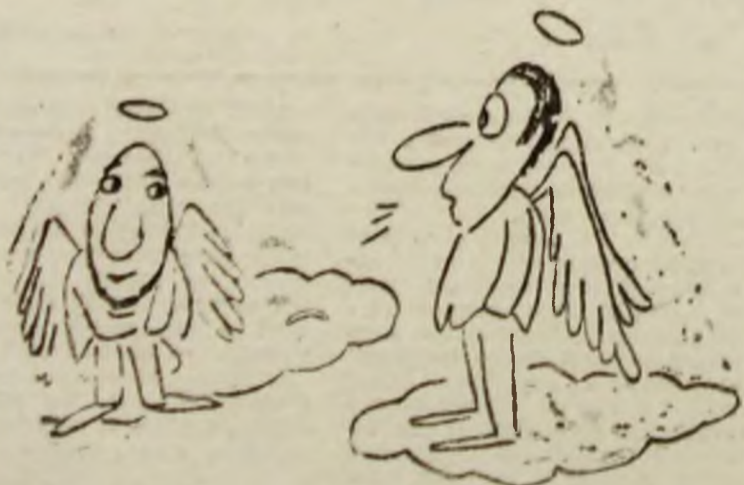
— Personal, n-am ce să-i reproșez: mă dureau bătăturile, așa că m-am dus la vrăciful ăla, care mi-a promis solemn că mă va trata în așa fel încît să-mi crească aripi, nu alta!!! (V.L.)

Recent, am avut ocazia să discut cu trei persoane autorizate de la Autobaza de transport a ICIL Simeria. Asta mi-a întărit convingerea că activitatea de transport al laptelui către centrele de desfacere nu se desfășoară foarte anevoios doar în Valea Jiului. La fel este în tot județul.