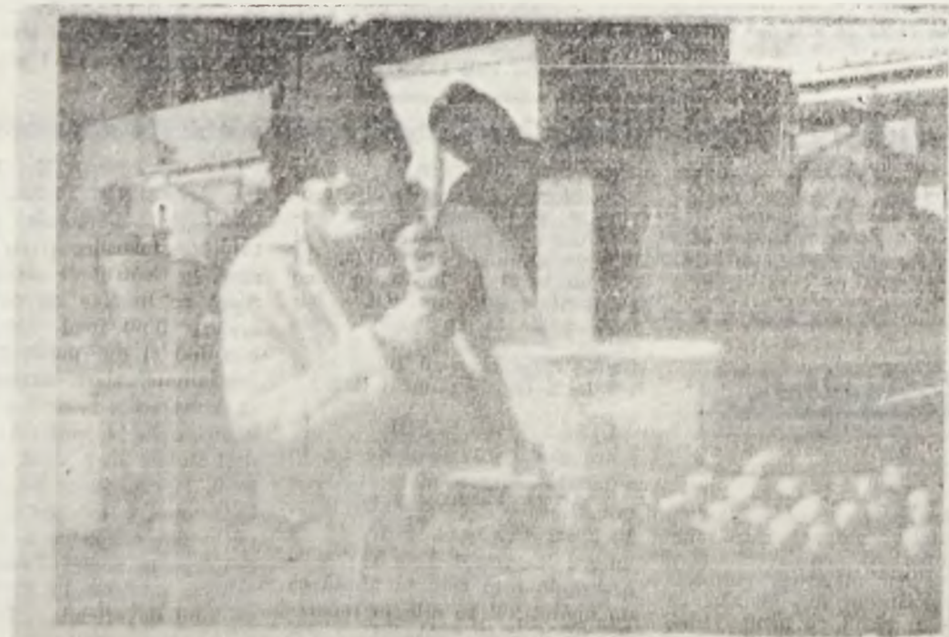
Moșulică se sprijină n băt, păzindu și nu mioarele ci... mercele. De unde se vede treaba că mercele discordiei încă n-au disoărut.