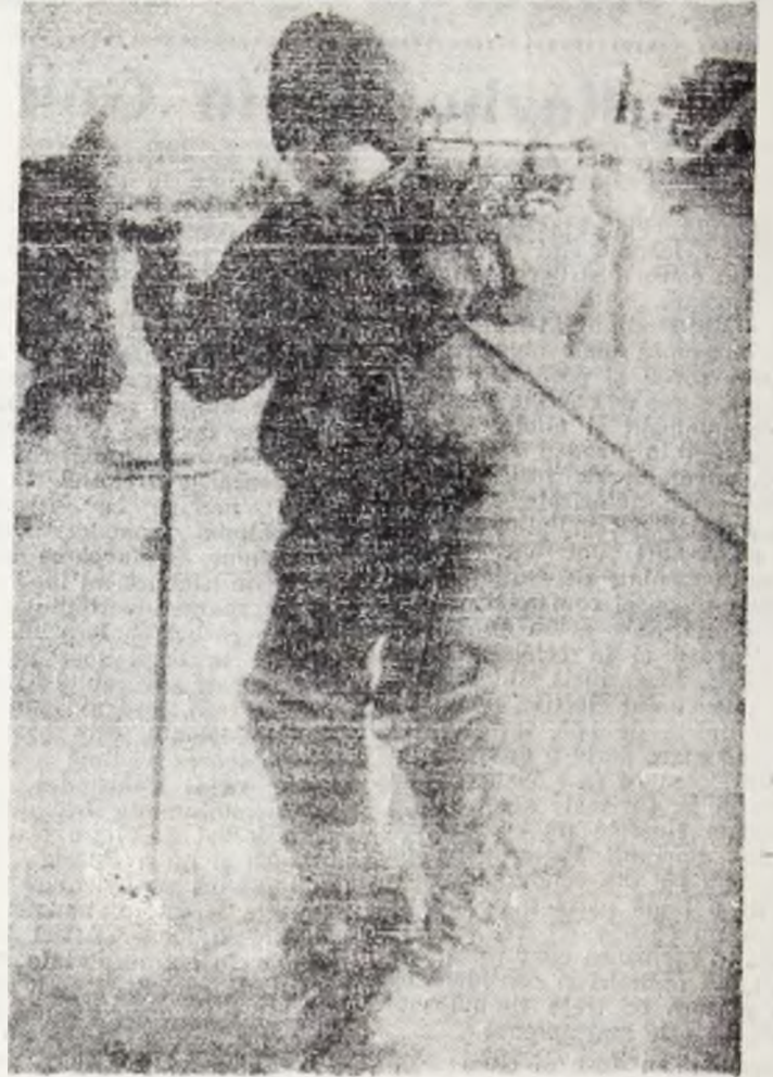
Zbor fără motor.