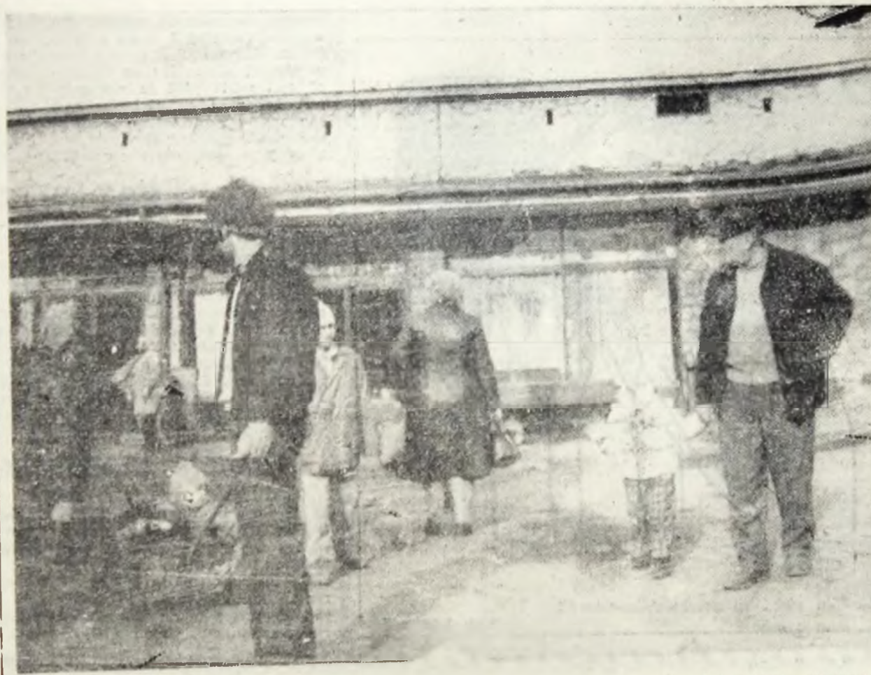
Piața — locul de pelerinaj al națiunii noastre democratice...