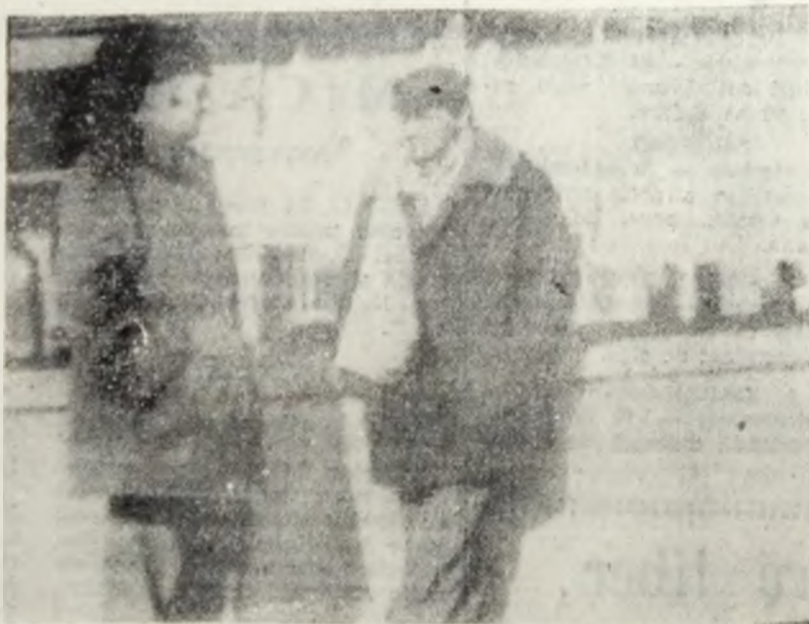
— Știi ce, eu nu mai cred în nimic.