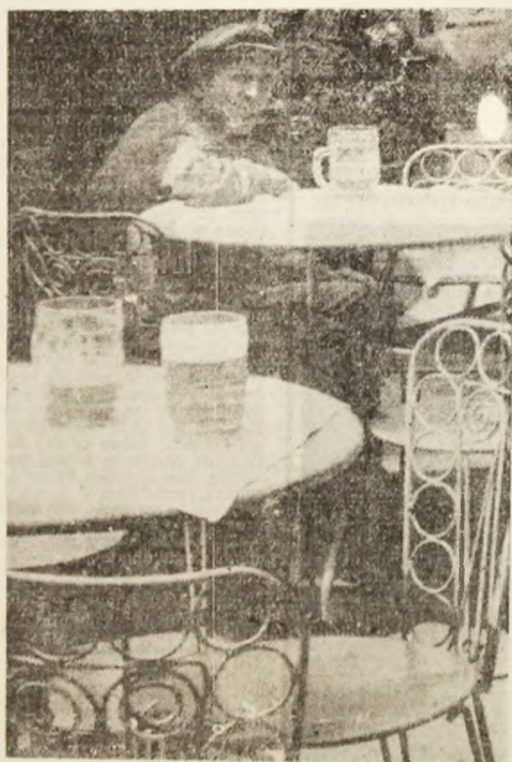
Meditație la gură, balbei.

Mă duceam, cu foarte puțină vreme în urmă, într-un orașel din Vestul țării. Nu aveam benzină suficientă, așa că, ajungând în Deva, unde este o stație modernă, m-am așezat frumos la rînd. Abia după trei ore și jumătate am aflat de ce înaintam atât de greu: ajunși la pompe, într-o proporție covârșitoare, automobilisții deschideau portbagajul și umpleau mai întîi canistrele, cite trei, patru, chiar cinci, apoi rezervoarele. M-am convins că situația era identică și în Arad, Timișoara, nu doar în Petroșani. Se petrece o schimbare de mentalități, că te cruțești nu alta. Individualismul — de înțeles, de altfel, întrucît în țările industrializate oamenii nu au timp efectiv să poposească și cu gîndul și cu fapta la ceilalți concitadini — este însoțit de o precară stare de civilizație, ceea ce era de neînțeles pentru turiștii străini, care priveau uimiți spectacolul de la acel Peco.