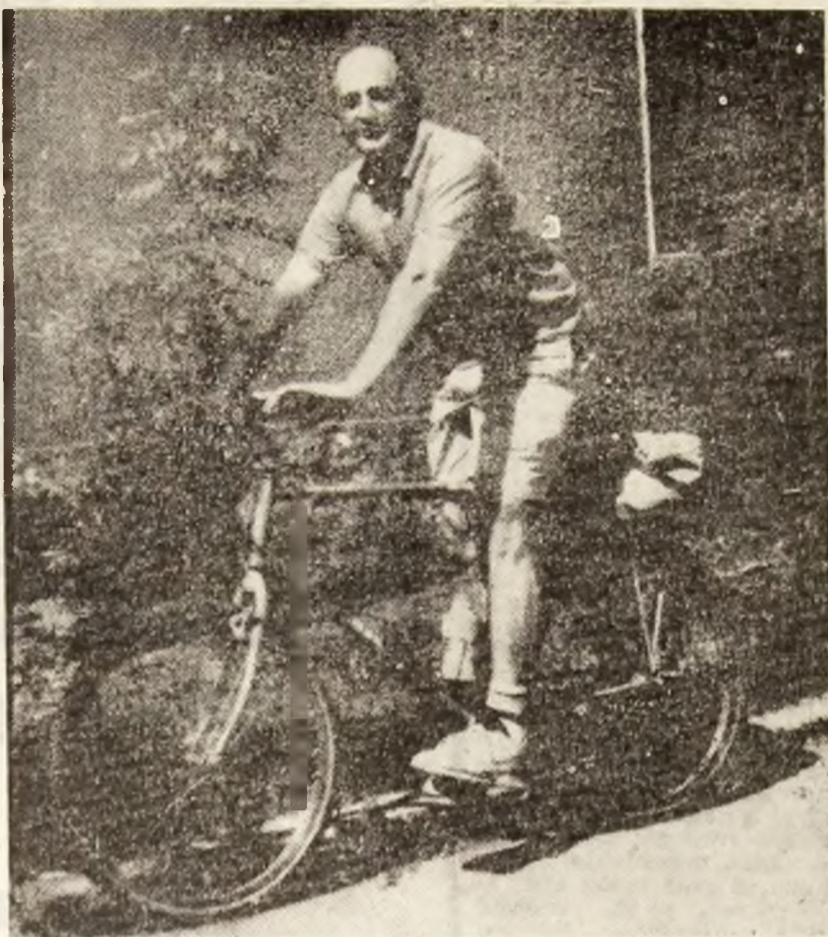
Cu noile prețuri la benzină, probabil, o să ne întoarcem cu toții la... bicicletă.