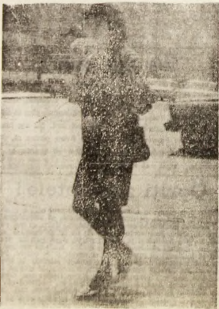
Să mai spună cineva că Petroșaniul nu poate sta alături de... Capitală...

Produsele expuse pe tarabele deschise din piețe nu îndeplinesc condițiile de comercializare și în consecință, rolul organelor sanitare trebuie să fie hotărîtor. Uneori o preintîmpinare face mai mult decât o amănunțită usturătoare înaintea căreia și-a pierdut viața un copil sau un adult.