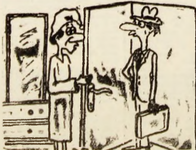
— De ce am lipsit de la serviciu? Tu n-ai văzut în Zodia ce zi nefavorabilă aveam? Desen de Robert HUMEL