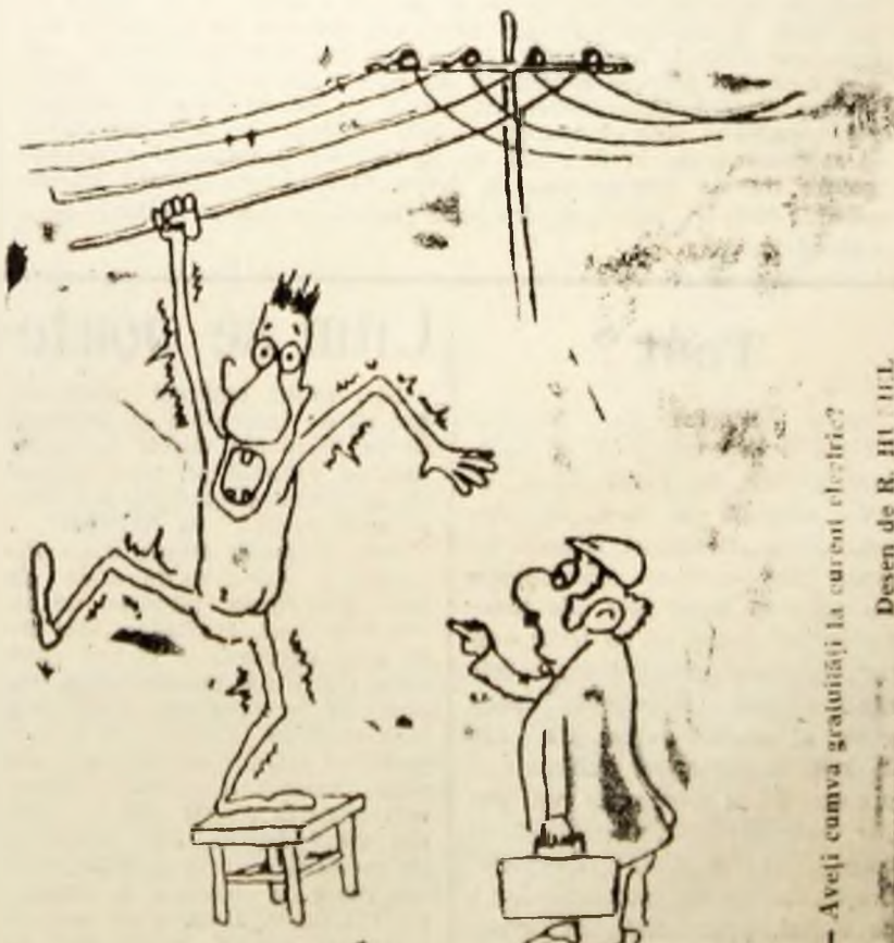
— Aveți cumva grătăși la curent electric? Desen de R. HUMEL

acumulat restanțe de peste o to- nă. Oamenii care au rămas fără zahăr îl înjură pe șeful magazini- nului, bănuindu-l de alte afaceri. Treaba nu e atât de alembicată și sîntem siguri că nu din rea vo- ință se procedează astfel. Aștep- tăm măsurile ce se impun.