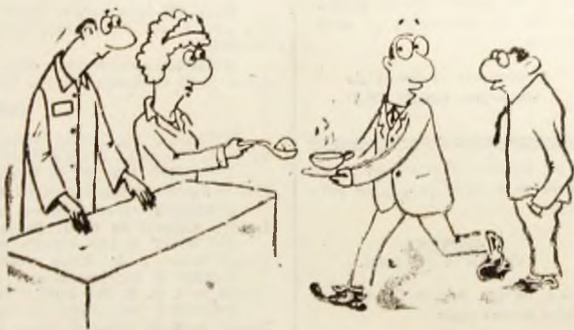
— Un moment să-mi iau cofa de zahăr.

Tot în depozite se mai găsesc 30 t unt, 90 t brînzetură, conserve carne, pește și alte produse necesare consumului zilnic. O relație cu Titan București se va finaliza în 100 t mălai, iar alta în peste 140 t carne pasăre. Pentru o țigară bună există și un neas bun. Totodată s-a întregit și parcul de mașini cu încă două „dube” de 10 t și două carosate a 7 tone, numărul total al mijloacelor de transport ajungînd acum la 20. Să credem deci că, dacă avem mașini vom avea și marfă. Da, pentru că, ea trebuie adusă de la sute și sute de km. Cînd parcul auto se mișcă e bine. (D.N.).