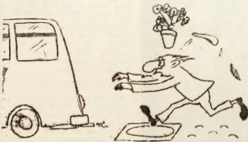
Nu cumva, azi, e 11 octombrie ?

depinde de cum negociezi, gogoșari — 50 de lei kilogramul și altele. Facem o comparație cu venitul mediu al unei familii și... dacă mai avem grai, tragem concluzii la vremea din crismele — privatizate sau nu —, din piață. Că sînt 5! (Al H.)