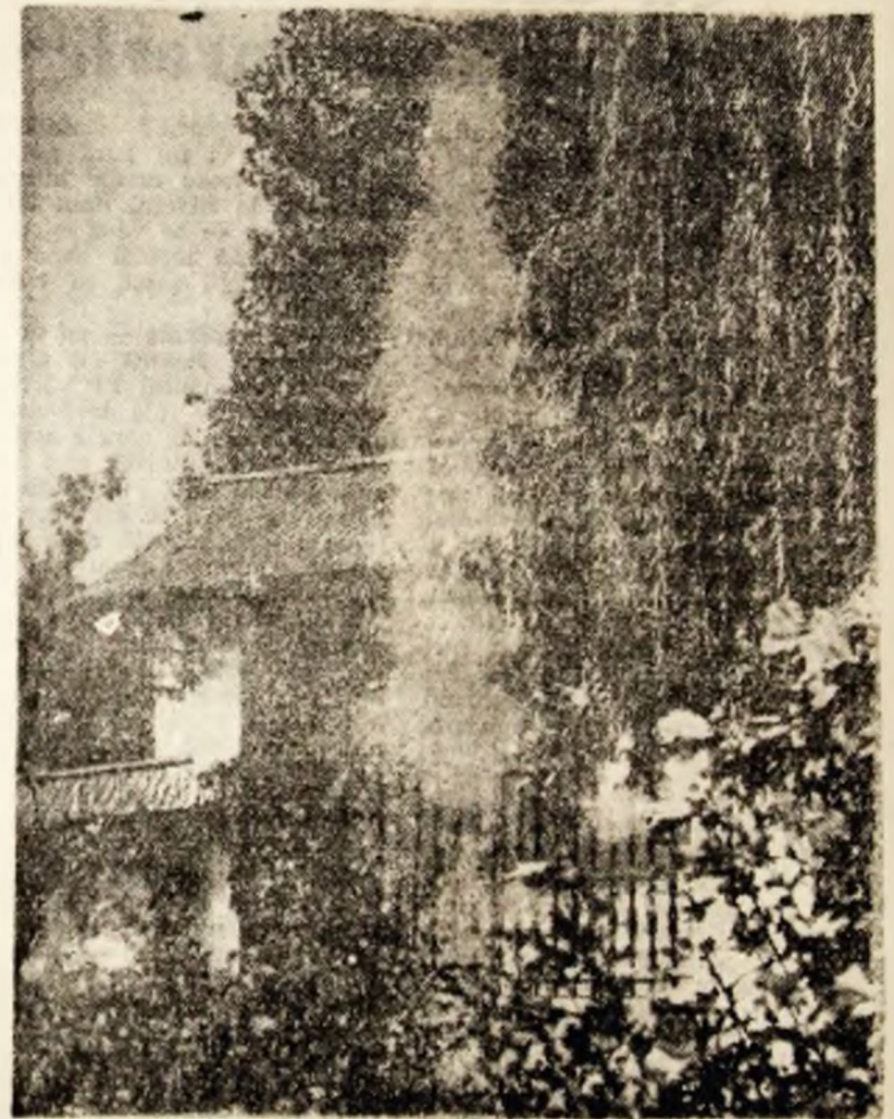
O poartă spre Danos — dar ce poartă se spune că este Andraș prin această fotografie. O poartă spre noi înșine, o poartă prin care merită și trebuie să trecem.