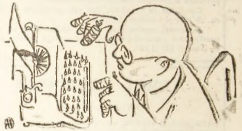
UN ALT FEL DE REPLICA

Necesitate zilnică, fără de care nu e viață, nu e nimic, apa constituie pentru colectivitatea umană, pentru administrația așezărilor urbane o problemă de maximă însemnătate. Dacă apa este sau nu o problemă, cei care traiesc în Valea Jiului o pot confirma. Și nu de azi, de ieri, ci de decenii... Apa devine o problemă cînd e insuficientă. Ori, aici, în Valea Jiului, unde atît sectorul industrial, cit și centrele urbane au crescut substanțial, sursele și rețeaua de alimentare cu apă au progresat în ritm de melc... S-au deschis mine, au apărut, s-au dezvoltat fabrici, servicii, au răsărit cartiere, orașe noi. Doar asigurarea apei, oricît ar fi ea de indispensabilă, a rămas mai la urmă, socotită fără a fi de o importanță deosebită. Parcă minerii după ce ies negri de cărbune din mină și intră sub dușuri, parcă gospodinele pentru a-și ține în curat casa și rufe, parcă viața în localitățile noastre dominate de fumul și praful de cărbune n-ar necesita prea multă apă. Nu înțelege și se miră lumea care vine prin Vale cum de putem noi lipsă de apă, cînd, pe toate dealurile curg atîtea pîraie, cînd la noi plouă mereu. Noli, cei care trăim resonați cu respecțiile de zi și de noapte, care primim apă caldă, dacă primim, o dată sau de două ori pe săptămîină... ce să ne mai întrebăm? Și, totuși? Care e situația, care e perspectiva soluționării