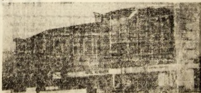
Societatea Comercială „PARINGUL” S.A.

boluri ale originalei noastre economii de piață. Vor fi respectate arhitectura, designul, precum și întreaga linie estetică ce face mîndria și cinstea orașului nostru. Este prevăzută și un util schimb de comercianți. Astfel o mare delegație de țigani bișnițari vor fi trimiși pentru procesul de emancipare a lucrătorilor din comerțul francez. Nu de alta, dar sînt și ei tot de gîntă latină... Recent, simbolul unității noastre naționale, românul Laszlo Tokes, a participat la o reuniune ce a avut loc undeva pe harta Europei. Pastorul, fără să aibă prea multe puncte comune cu păstoritul, a recitat versuri din poemul național Miorița. Cele mai încălțate de patos s-au dovedit a fi versurile: „Baciul moldovean / și eu cel vrîncăean / la apus de soare / vîr să mi-l omoare / pe cel unguerean / că e din alt neam”. Deși s-a depus un efort în arta interpretativă, juriul nu a acordat nici un premiu interpretului. Buletin meteo: aflăm de la institutul de specialitate că la sfîrșitul acestei săptămîni va fi dominică. Chiar dacă ziua cerul va fi senin, orizontul va rămîne tot întunecat. Noaptea se va produce întuneric. Temperaturile scăzute vor fi minime, iar cele maxime vor fi deosebit de scăzute. Recomandăm pentru acest sfîrșit de săptămîină petrecerea timpului liber în frigider, care oricum e gol și unde oricum e mai cald decît lângă calorifer. Cu acestea vă dorim un week-end plăcut!