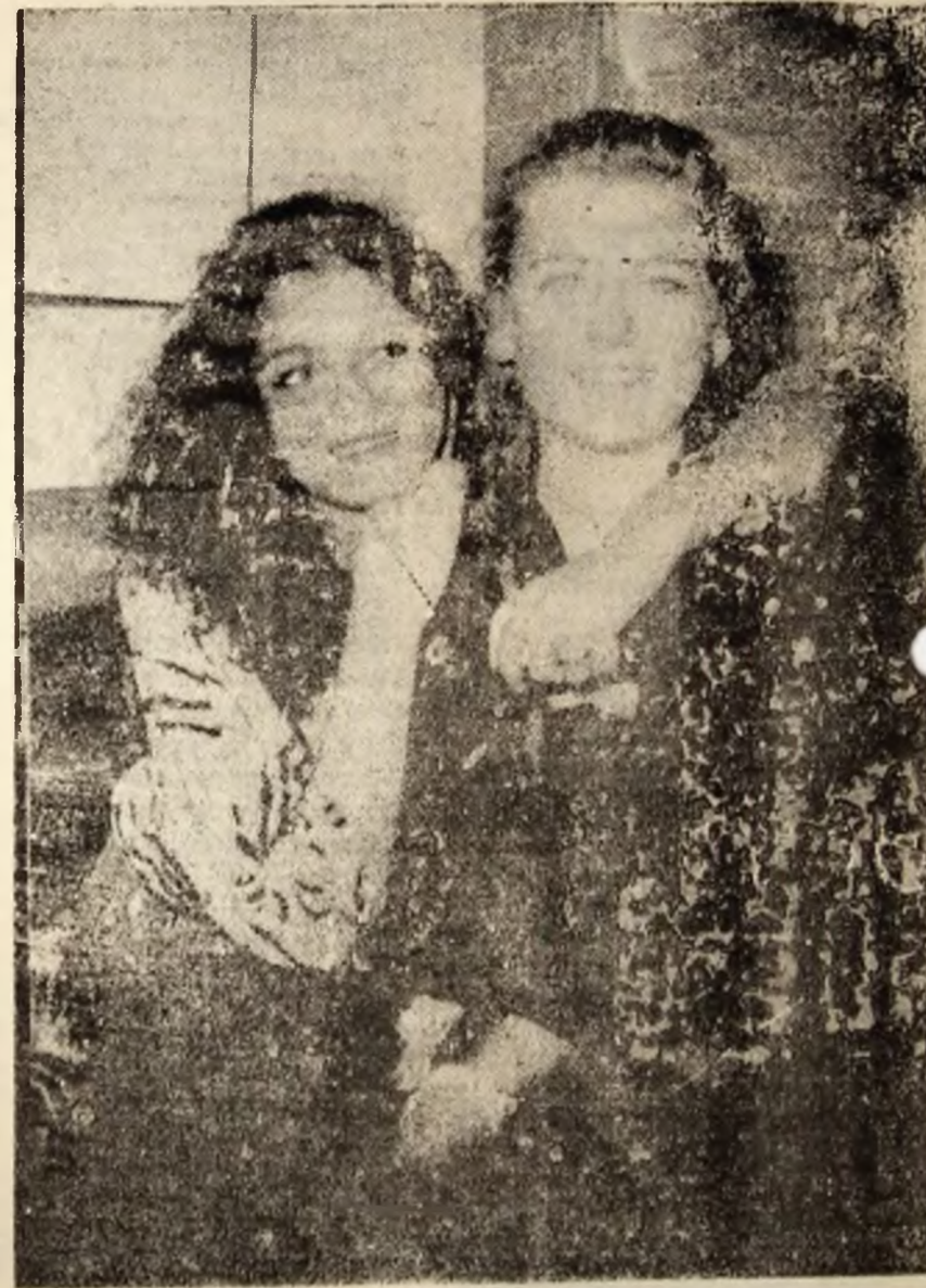
Mi-s tare trist, cind dau de MISS.