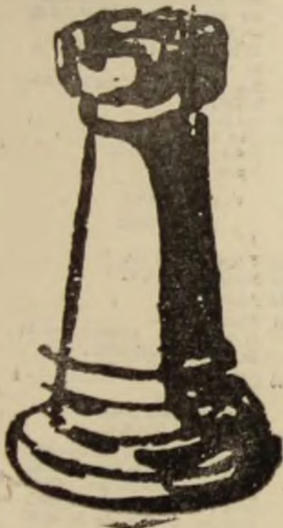
Ilustrația acestui număr Sorin OPREA

Cel dintii S.O.S. a fost lansat la 15 februarie 1900, cînd pentru întâia dată s-a stabilit o legătură radiofonică între un vapor în primejdie și uscat. Folosind aparatele radio tip Popov, s-a izbutit să se stabilească legătura între un crucișător rusesc eșuat pe coastă și insula Hogland din golful Finlandei. Mesajele astfel expediate au salvat crucișătorul. Ulterior, în 1906 se introduce în mod oficial în navigația oceanică și maritimă semnalul convențional de salvare S.O.S., a cărei necesitate a fost apreciată la Congresul Internațional Maritim din 1903.