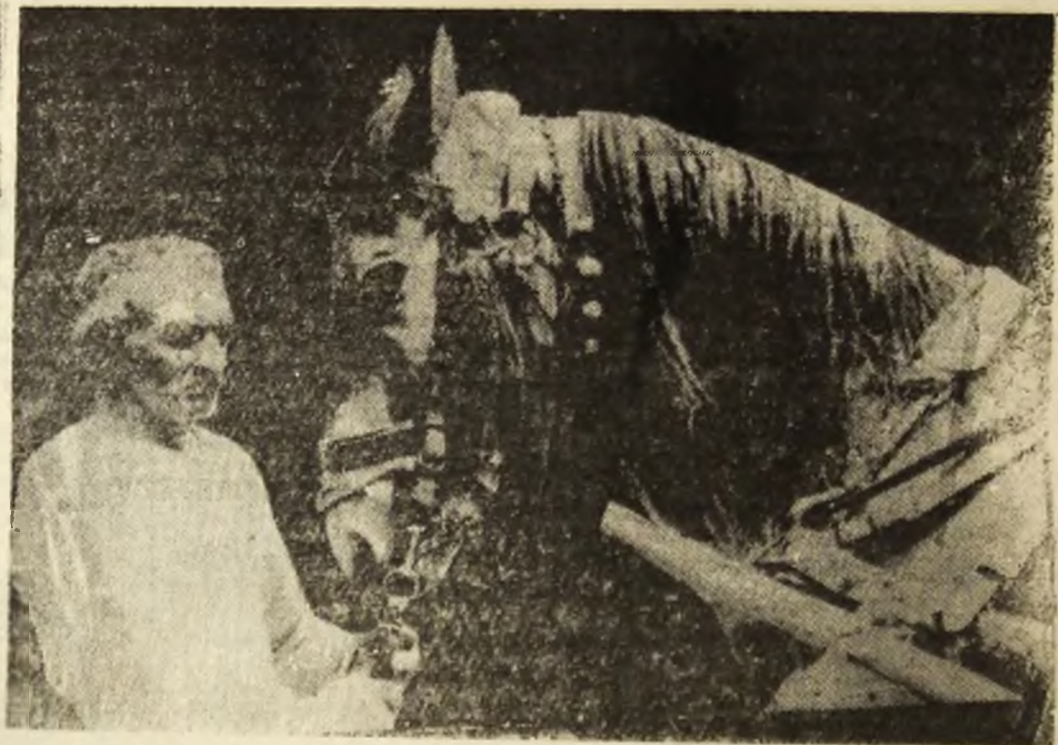
De la curtea regelui fotbal

■ Cine e minerul și ce vrea el? ■ O mască rîde, o mască plînge (PAG. A 3-A)