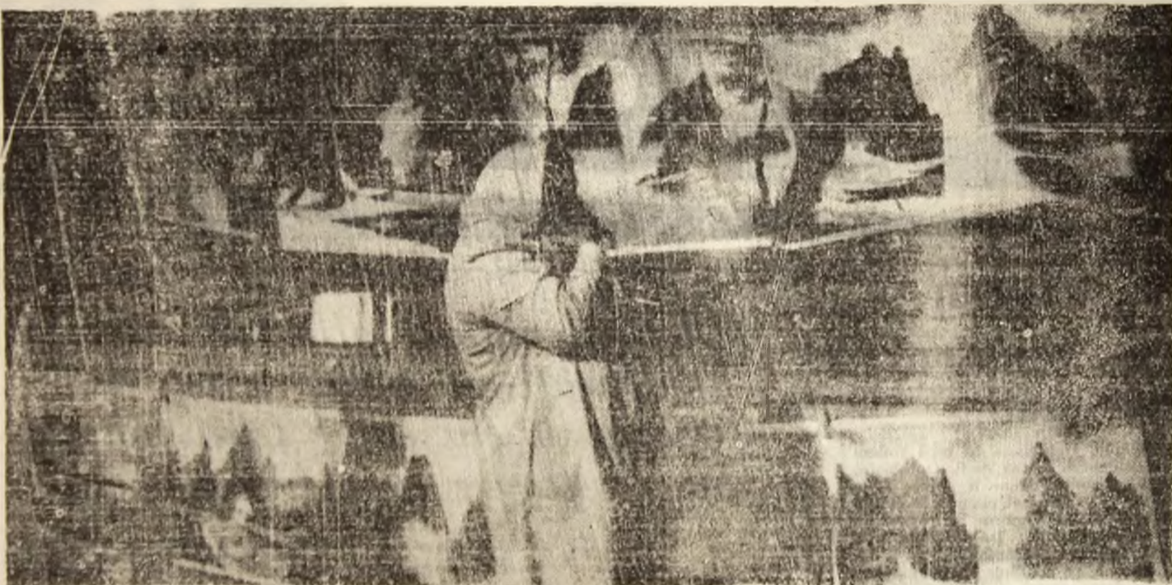
Hai, kitsch, kitsch și iar kitsch, kitsch, mari sintem și cit de mici...