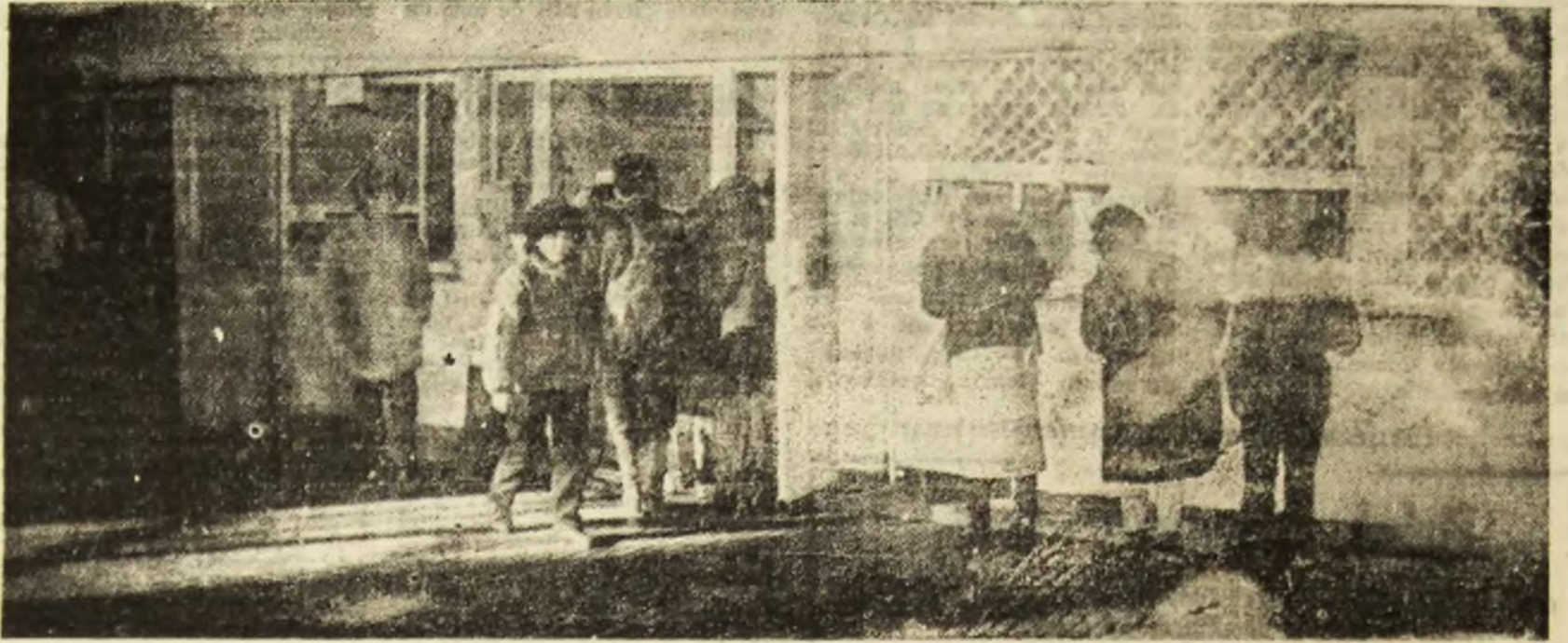
Pagină realizată de Sorin OPREA Dorel NEAMȚU

Orice s-ar spune, imaginea pieței reflectă cu prisosință nivelul de trai și gradul de civilizație al unui popor. Cantitatea, calitatea și prețul produselor dau imaginea finală a felului în care știm să trăim. Eforturile noastre actuale sînt îndreptate spre a crea o imagine civilizată pieței noastre, în rezonanță cu pretențiile unui comerț modern.