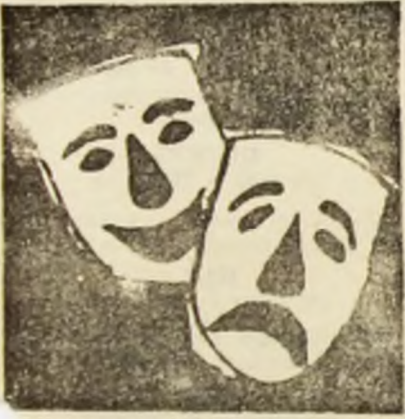
ÎNAINTE ŞI DUPĂ LEAFĂ