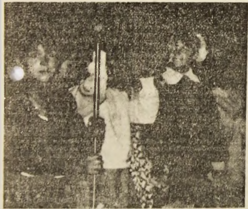
„Eu știu că veșnicia s-a născut la sat”